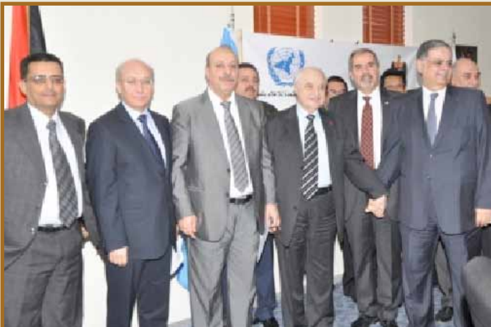
لقطة تذكارية من الحفل

المنامة - شارك الدكتور طلال أبوغزاله في احتفال التضامن مع الشعب الفلسطيني الذي تقيمه الأمم المتحدة سنوياً.