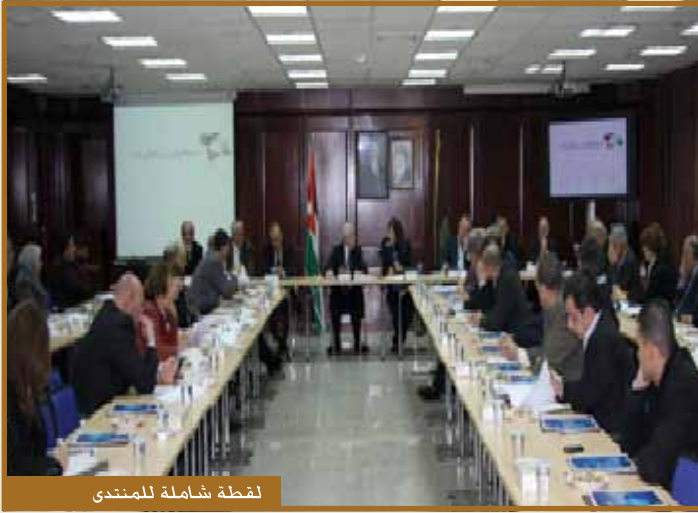
لقطة شاملة للمنتدى

عمان - عقد منتدى دعم السياسات الاقتصادية في الأردن اجتماعه العام السادس يوم ٢١ كانون الأول ٢٠١١ في مبنى كلية طلال أبوغزاله للدراسات العليا في إدارة الأعمال.