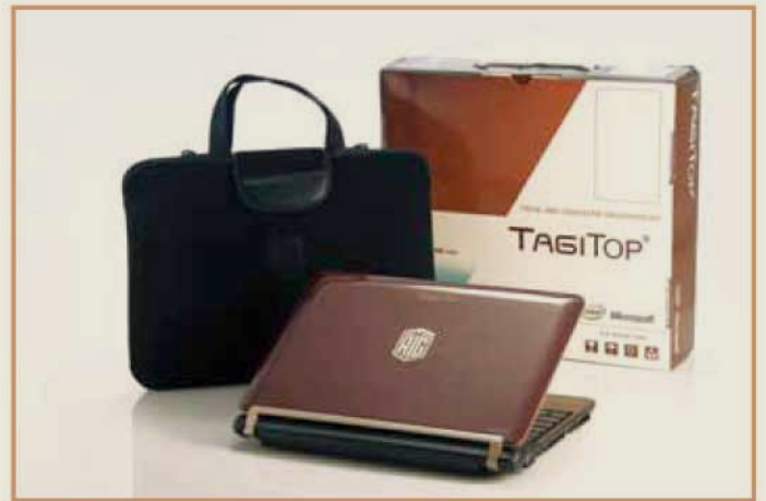
الإصدار الأول من جهاز تاجي توب