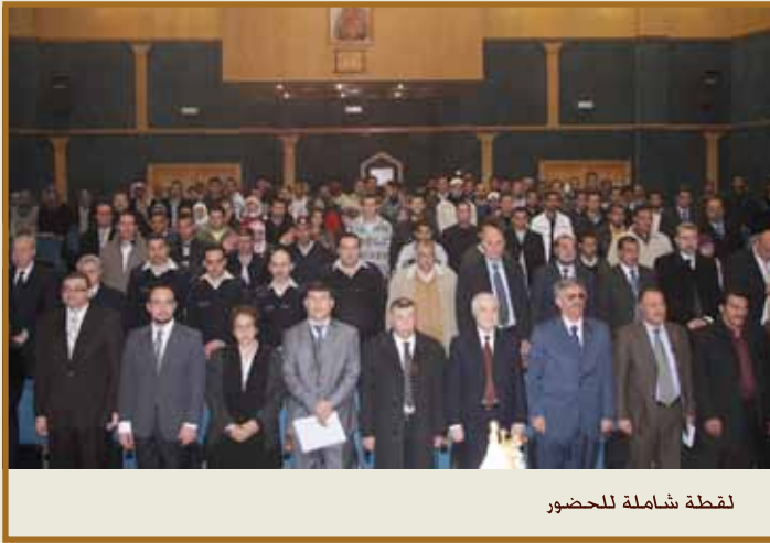
لقطة شاملة للحضور

نطالب بتطوير برنامج تدريبي صارم لمنع حدوث الفساد والكشف عنه حال حدوثه