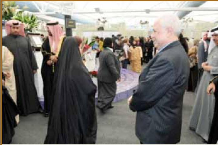
سمو الأميرة سبيكة بنت إبراهيم آل خليفة و د. طلال أبوغزاله

المنامة - تحت رعاية صاحبة السمو الملكي الأميرة سبيكة بنت إبراهيم آل خليفة قرينة عاهل البحرين رئيس المجلس الأعلى للمرأة. وتلبية لدعوة من المجلس الأعلى للمرأة البحرينية شارك الدكتور طلال أبوغزاله في الاحتفال بمناسبة ذكرى مرور عشر سنوات على إنشاء المجلس الأعلى للمرأة وبمناسبة يوم المرأة البحريني.