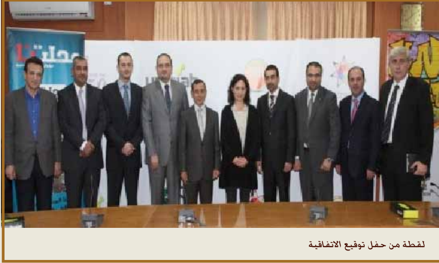
لقطة من حفل توقيع الاتفاقية

عمان - شهدت قاعة مجلس العمداء بمبنى رئاسة الجامعة الأردنية، حفل إطلاق خدمة بطاقة «Uni Card» الذي نظمته شركته التفتاني، وتهدف هذه الخدمة إلى دعم الطلاب بالأردن والتخفيف من أعبائهم المالية اليومية.