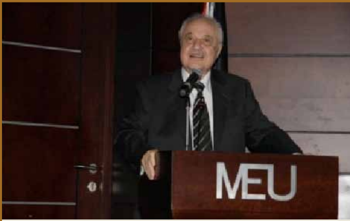
د. طلال أبوغزاله خلال الندوة

عمان - وقع مركز طلال أبوغزاله للمعرفة وجامعة الشرق الأوسط على مذكرة تفاهم تقضي بأن ينظم مركز أبوغزاله للمعرفة دورات تدريبية في مجال المهارات الأساسية للطلبة الخريجين بحيث يختار الطالب المتدرب خمس دورات من أصل عشر دورات تدريبية من خلال مركز الشرق الأوسط للاستشارات والتدريب/ جامعة الشرق الأوسط. وتهدف المذكرة كذلك إلى زيادة الاستثمار في الموارد البشرية وتوظيف التكنولوجيا في الدراسة للانخراط في الحياة العملية.