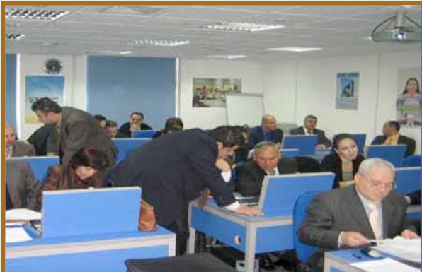
إحدى قاعات الكلية

عمان - إختارت مجموعة الاستشارات الخيرية الأردنية «مدلابز» القاعات التدريبية في مبنى كلية طلال أبوغزاله للدراسات العليا في إدارة الأعمال لعقد امتحانات خاصة بالمجموعة شارك فيها نحو ١٦٥ طالباً وطالبة. توزعوا على ثلاث قاعات. وقدموا الامتحانات في أجواء هادئة.