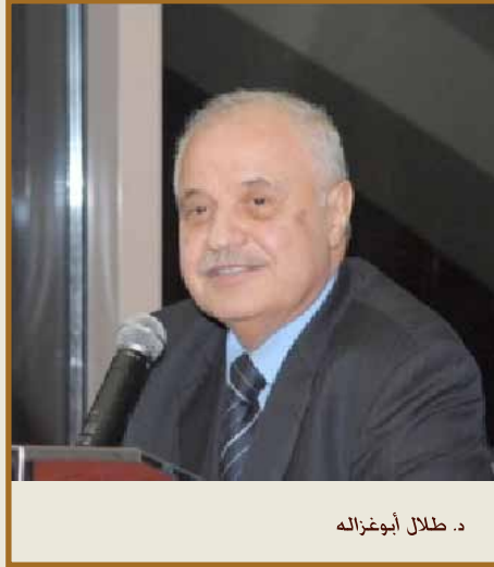
د. طلال أبوغزاله

ورداً على سؤال حول تطورات القضية الفلسطينية قال: «يجب أن نعود إلى جوهر القضية وننادي بصوت واحد الشعب يريد إنهاء الإحتلال. لأنه لا سلام مع الإحتلال. كما أجاب على أسئلة أخرى تتعلق بالأزمة الاقتصادية في الغرب وعن النهضة العربية وعن مبادرة رعاية ودعم المبدعين الفلسطينيين المتمثلة بـ (ALL Palestine 4)».