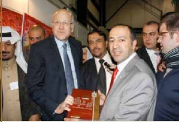
الرئيس ميقاتي يتفقد جناح المجموعة

بيروت - شاركت مجموعة طلال أبوغزاله- مكتب بيروت في معرض بيروت العربي الدولي للكتاب الـ ٥٥ الذي نظمه النادي الثقافي العربي بالتعاون مع اتحاد الناشرين اللبنانيين. برعاية رئيس مجلس الوزراء الأستاذ جيب ميقاتي. وبحضور الرئيس فؤاد السنيورة . وزير الأشغال العامة والنقل الأستاذ غازي العريضي. ووزير الإعلام وليد الداعوق ووزير الثقافة كابي ليون. وعدد من السفراء العرب والأجانب والشخصيات السياسية والعسكرية والدينية والثقافية والإعلامية وأصحاب دور النشر المشاركة. وقد تفقد الأستاذ ميقاتي جناح المجموعة . كما زاره عدد من المسؤولين وحشد من زوار المعرض.