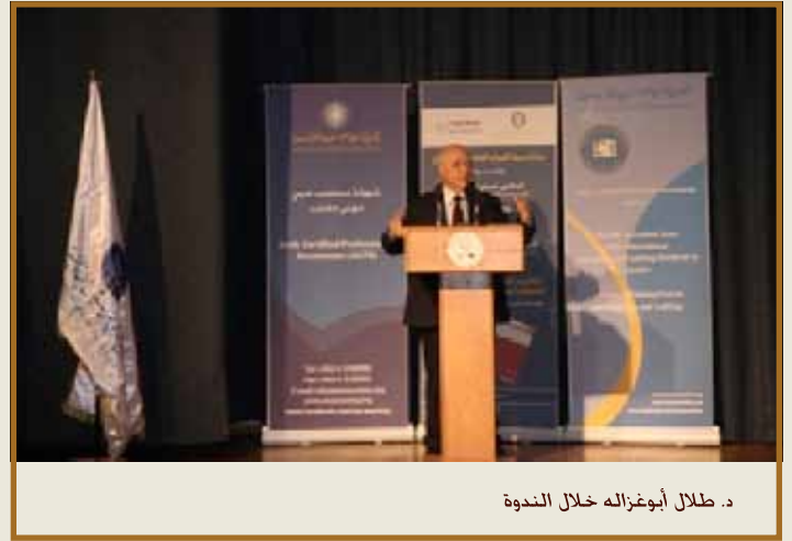
د. طلال أبوغزاله خلال الندوة

نضع نظاماً ثقافياً وأخلاقياً وتربوياً وتوعوياً ومجتمعياً لأن الفساد يضر بنفسه وبحياته ومجتمعه وطالب بوضع ميثاق قانوني وأخلاقي يحد من الفساد أو يمنع ويكمن مشتركاً بين الجامعة والمجمع باسم (الحاكمة الصالحة) أو (الإدارة الصالحة) ويعرضه على المشرع وصانع القرار.