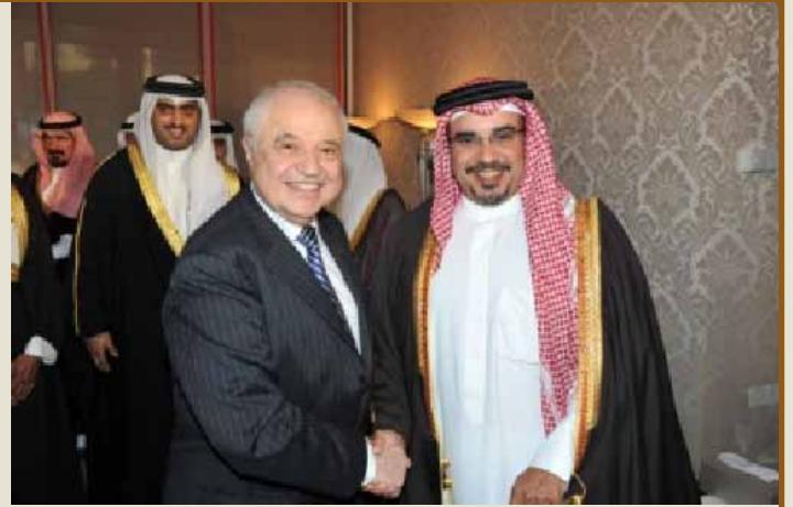
سمو الأمير سلمان بن حمد آل خليفة يستقبل د. طلال أبوغزاله

ومدير جامعة أنديرا غاندي سابقاً رئيساً للجامعة. وأوضح أبوغزاله جاهزية الجامعة إستعداداً للتدريس حال صدور الترخيص.