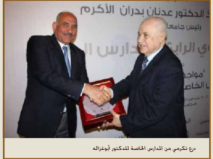
درع تكريمي من المدارس الخاصة للدكتور أبوغزاله

وعن المستقبل قال: «ما سنصل إليه قد لا تدركه عقولنا الآن. فنحن مقبلون على عالم مختلف ولن يكون هناك أكثر من ٢٠٪ من مباني ومنشآت جامعية. وأشار إلى أن البيئة التعليمية الحالية عبارة عن معسكرات تعليم لا تشجع على التعلم. ورغم ذلك يقول أبوغزاله أنا لست قلقاً على مستقبل هذه الأمة العظيمة وأمامنا فرصة تاريخية حيث تتاح لأولادنا وأحفادنا فرص متساوية مع الآخرين ويملكون جينات أفضل تمكنهم من التفوق ناهيك عن تاريخنا وحضارتنا العربية، ولكن ليس هناك شحذ فكري كافٍ للتعامل مع تحديات المستقبل».