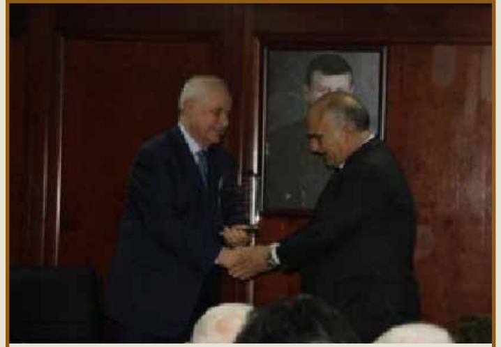
د. طلال أبوغزاله يقدم الدرع لسمو الأمير الحسن

وقد أثنى سمو الأمير على مبادرة الدكتور طلال أبوغزاله في تأسيس كلية طلال أبوغزاله لإدارة الأعمال قائلاً: «صاحب في تأسيس كلية طلال أبوغزاله لإدارة الأعمال قائلاً: «لا تلتزم الكلية فقط بأهدافها لأن تصبح «هارفارد العالم العربي» ولكنها أيضاً مؤسسة تضع القيم الأخلاقية جنباً إلى جنب مع الخبرة الأكاديمية والتكنولوجية». وأضاف الأمير الحسن يقول: «تسهل كلية طلال أبوغزاله لإدارة الأعمال في إعادة بناء الأردن من خلال بناء جيل كامل من الخريجين ولكن لم تعد إعادة البناء أمراً كافياً. وأقول مرة أخرى: التعليم للمواطنة والتعليم للسلام والتعليم للحياة».