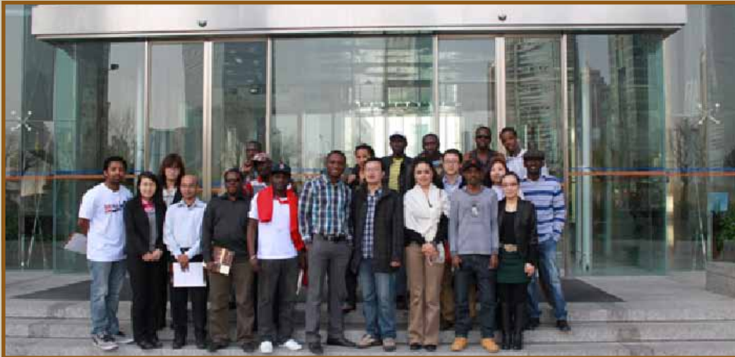
وفد جامعة نانشانغ

وقد تم تصنيف معهد كونفوشيوس الذي أسسته جامعة نانشانغ باعتباره من أفضل المعاهد على مدار خمس سنوات متتالية من قبل المقر الرئيسي لمعهد كونفوشيوس.