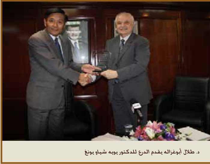
د. طلال أبوغزاله يقدم الدرع للدكتور يويه شياو يونغ

عمان - استضاف ملتقى طلال أبوغزاله للإعمال يوم أمس الأول من نيسان ٢٠١٢ الدكتور يويه شياو يونغ سفير جمهورية الصين الشعبية في محاضرة حول الصين في مرحلة التحول الجديدة حضرها مسؤولون وسفراء وقادة مجتمع المعرفة وطلبة كلية طلال أبوغزاله للدراسات العليا في إدارة الأعمال.