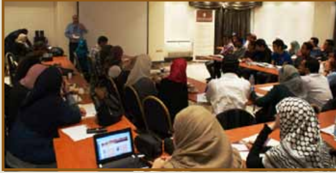
المشاركون في ورشة العمل

القاهرة - نظمت مجموعة طلال أبوغزاله للتدريب المهني/ مكتب القاهرة بالتعاون مع المنظمة الكشفية العربية (مركز الجرافيك والميديا) ورشة عمل حول كيفية تصميم الشعار (logo) والتعريف بالملكية الفكرية والتطور التاريخي لها.