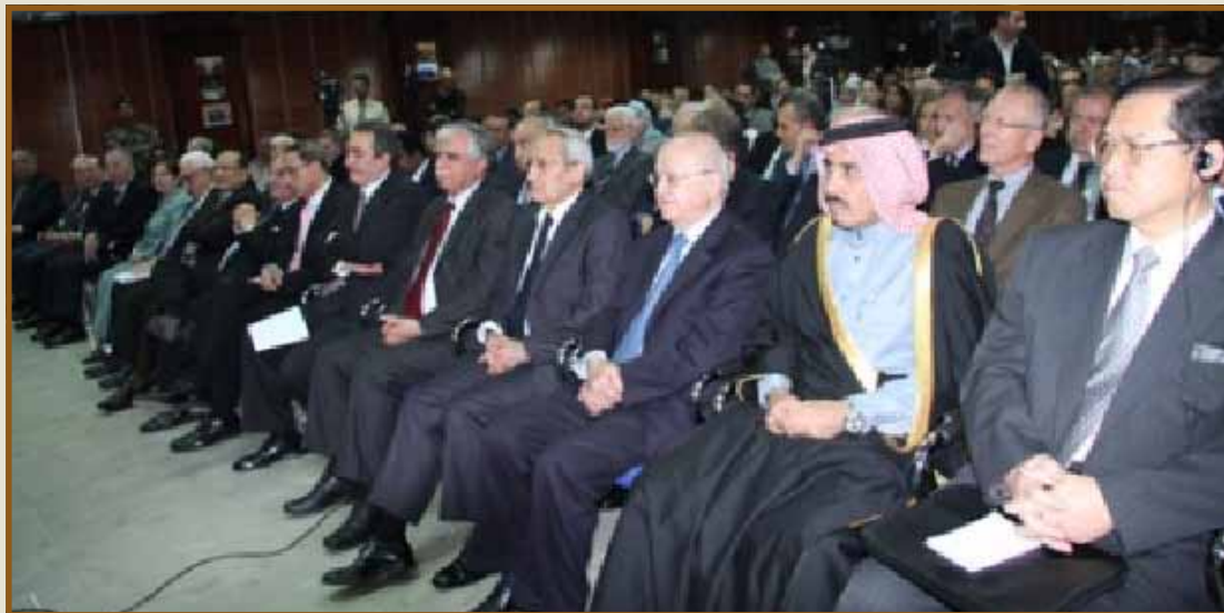
جاناب من الحضور

وقد أثنى سمو الأمير على مبادرة الدكتور طلال أبوغزاله في تأسيس كلية طلال أبوغزاله لإدارة الأعمال قائلاً: «صاحب في تأسيس كلية طلال أبوغزاله لإدارة الأعمال قائلاً: «لا تلتزم الكلية فقط بأهدافها لأن تصبح «هارفارد العالم العربي» ولكنها أيضاً مؤسسة تضع القيم الأخلاقية جنباً إلى جنب مع الخبرة الأكاديمية والتكنولوجية». وأضاف الأمير الحسن يقول: «تسهل كلية طلال أبوغزاله لإدارة الأعمال في إعادة بناء الأردن من خلال بناء جيل كامل من الخريجين ولكن لم تعد إعادة البناء أمراً كافياً. وأقول مرة أخرى: التعليم للمواطنة والتعليم للسلام والتعليم للحياة».