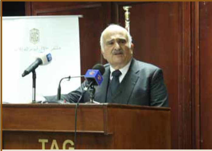
سمو الأمير الحسن بن طلال