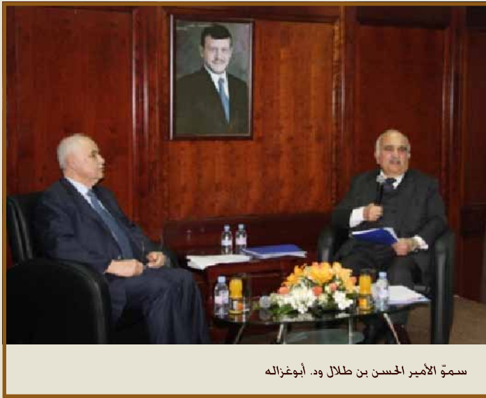
سمو الأمير الحسن بن طلال ود. أبوغزاله

الحسن: «لن نتمكن من ترسيخ مفهوم المواطنة وشعور المسؤولية في العالم العربي ما لم نكن قادرين على وضع نظام تعليمي أفضل وإتاحة فرص أكثر»