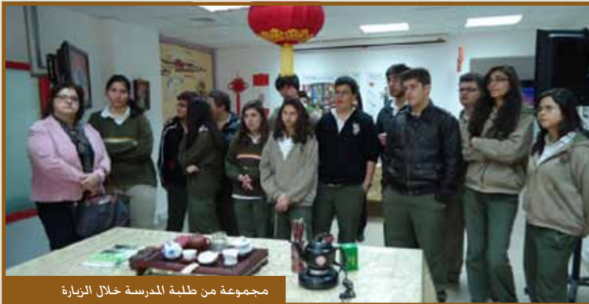
مجموعة من طلبة المدرسة خلال الزيارة

عمان - استضاف معهد طلال أبوغزاله - كونفوشيوس «تاج كونفوشيوس»، المركز الرسمي المعتمد لإجراء اختبارات الكفاءة باللغة الصينية، مجموعة من طلاب مدرسة عمان الوطنية .