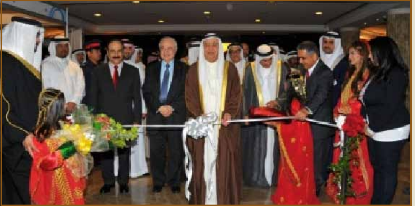
سمو الشيخ محمد بن مبارك آل خليفة ود. طلال أبوغزاله خلال الإفتتاح

الملك حمد بن عيسى آل خليفة. فقد إحتلت البحرين الترتيب الأول إقليمياً في مؤشر الخدمات الإلكترونية وفق تقرير الأمم المتحدة لجاهزية الحكومة الإلكترونية للعام ٢٠١٢، والذي أشاد بدور المملكة في العمل على تنفيذ مبادرات مبنية على مقترحات المواطنين.