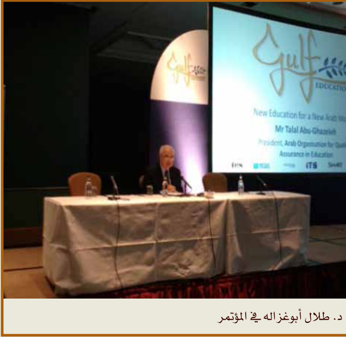
د. طلال أبوغزاله في المؤتمر

لندن - أكد الدكتور طلال أبوغزاله رئيس المنظمة العربية لضمان الجودة في التعليم بأن مؤتمر ومعرض الخليج للتعليم الذي عقد في العاصمة البريطانية لندن أتاح فرصة فريدة لإستكشاف الفرص الهائلة التي أفرزتها البيئة الإقليمية العالمية المتغيرة من أجل تعليم أفضل لمستقبل أطفالنا في منطقة الخليج والعالم العربي.