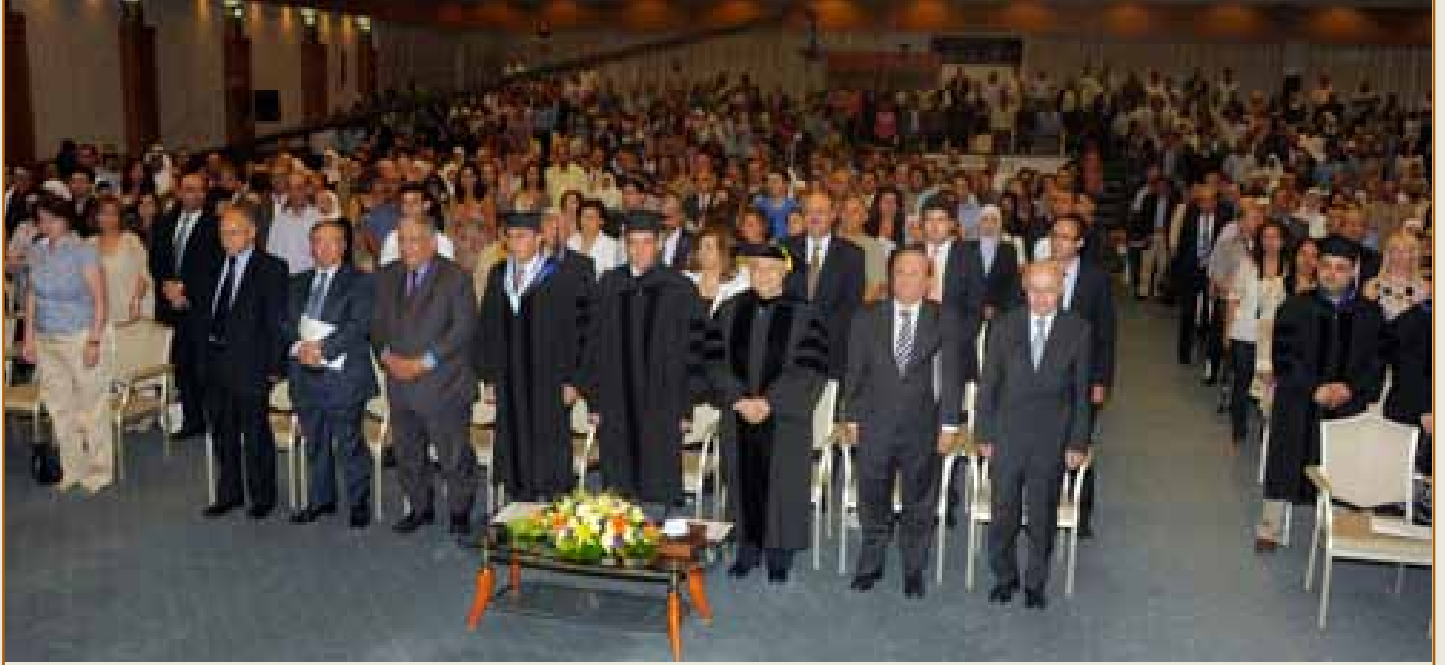
صورة من حفل الافتتاح

عمان- احتفلت كلية طلال أبوغزاله للدراسات العليا في إدارة الأعمال / الجامعة الألمانية الأردنية يوم ١٩ حزيران ٢٠١٢ بتخريج الفوج الرابع من طلبة الماجستير. أقيم الحفل في المركز الثقافي الملكي برعاية السيد رالف طراف سفير جمهورية ألمانيا الاتحادية بحضور الدكتور طلال أبوغزاله رئيس المجلس الاستشاري للكلية والدكتور لبيب الخضرا رئيس الجامعة الألمانية الأردنية والدكتور أمين محمود رئيس مجلس أمناء الجامعة وأعضاء المجلس وأعضاء المجلس الاستشاري والهيئة التدريسية والإدارية في الكلية وأهالي الطلبة.