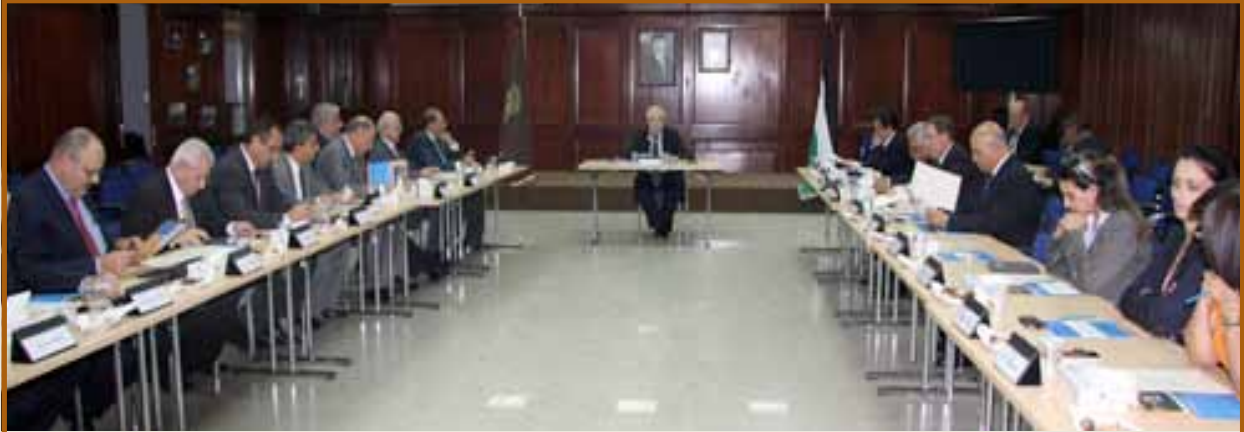
لقطة لاجتماع المجلس الإستشاري.

بعد ذلك بحث المجلس في عدد من الموضوعات الحيوية وفي مقدمتها الأعداد المتزايدة من الطلبة الراغبين بالإلتحاق بالكلية من داخل وخارج الأردن وبما يفوق الطاقة الإستيعابية وطرحت إقتراحات برفع مستوى شروط معدلات القبول وبهذا الخصوص أكد رئيس المجلس بأن معيار الكلية هو التفوق والتميز كأحد أهم الشروط للقبول.