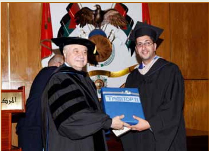
لقطتان من تكريم اوائل الطلبة