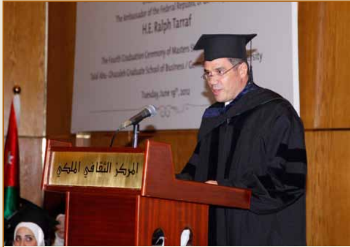
السفير رالف طراف

ألقى راعي الحفل السفير رالف طراف كلمة أشاد فيها بحكمة جلالة الملك عبد الله الثاني بن الحسين على دعمه المتواصل لمشروع الجامعة والذي يعتبر قصة نجاح بين الأردن وألمانيا التي حققتها كلية طلال أبوغزاله خلال سنوات قليلة وأشاد بالشراكة الفريدة من نوعها بين القطاعين الخاص والحكومي المتمثل في تأسيس الكلية وقال لقد شكلت هذه الشراكة نموذجاً جديداً للتعليم العالي بفضل التعاون والجهود المشتركة وما قدمه الدكتور طلال أبوغزاله المحرك والمعلم والملم لهذا المشروع.