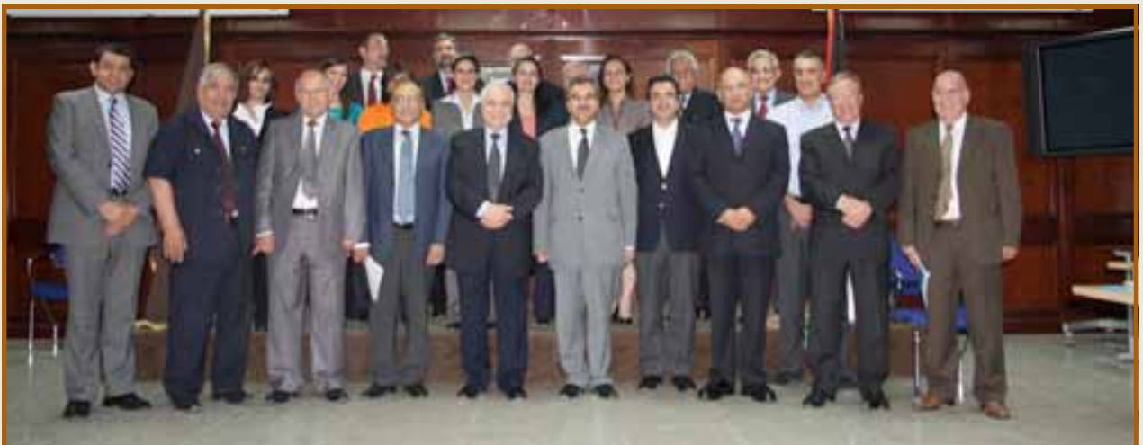
صورة تذكارية للمجلس

وقال: «أننا نعتز بهذه الكلية التي تمثل الشراكة الوحيدة بين القطاعين الحكومي والخاص كإحدى الكليات الأساسية في الجامعة الألمانية الأردنية المشروع العلمي المشترك بين الحكومتين الألمانية والأردنية، حيث أثبت هذا المزيج بأنه يعطي الفوائد الجمة والنجاح».