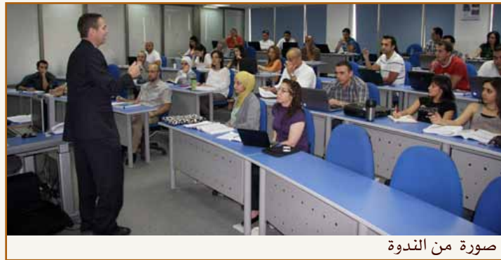
صورة من الندوة