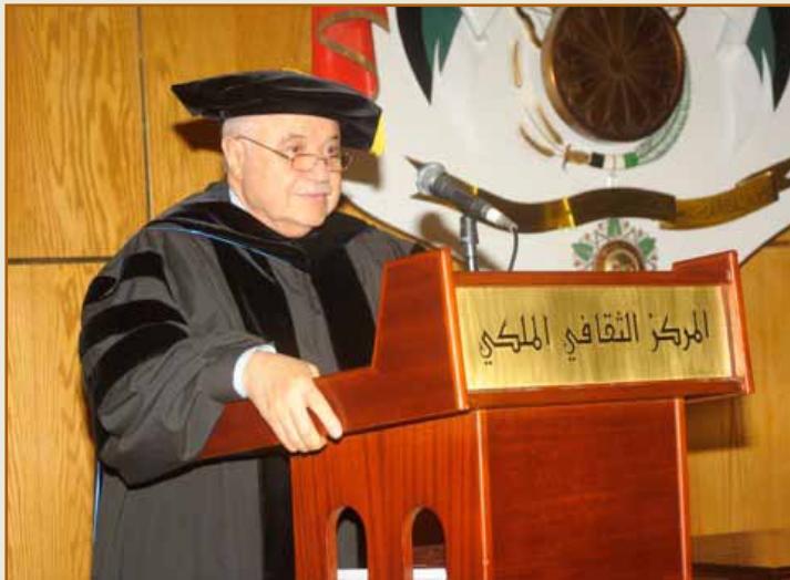
د. طلال ابو غزاله

وألقى الدكتور طلال أبوغزاله كلمة استذكر فيها توجيهات جلالة الملك عبد الله الثاني بن الحسين في جعل التعليم العالي يتصدر سلم أولويات بلدنا وحكومتنا، كما عبّر الدكتور طلال أبوغزاله عن أصدق التهاني للخريجين وأهاليهم، وقال أنه يحق لكم أن تفخروا وتحفظوا اليوم بما أنجزتموه، وتقدم بالشكر والتقدير لراعي الحفل سعادة الأستاذ رالف طراف.