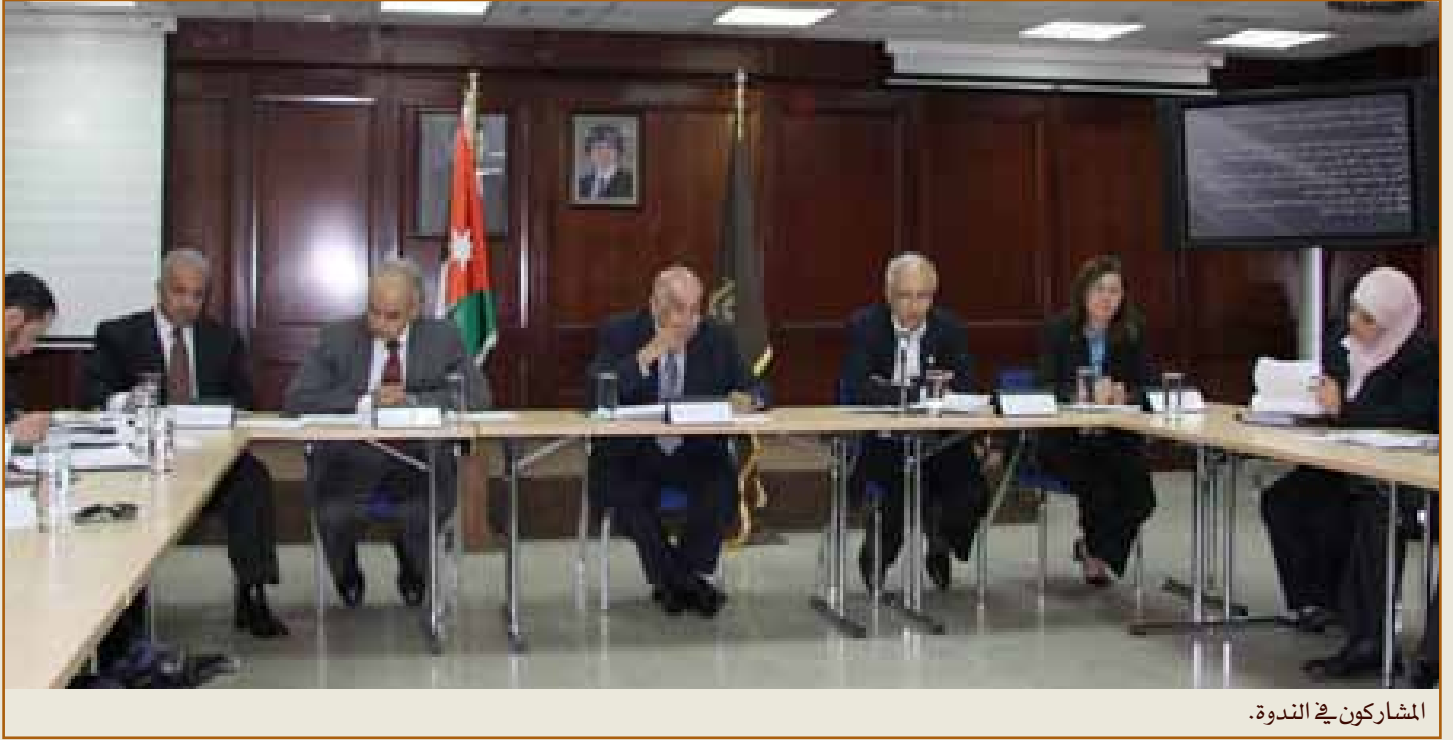
المشاركون في الندوة.