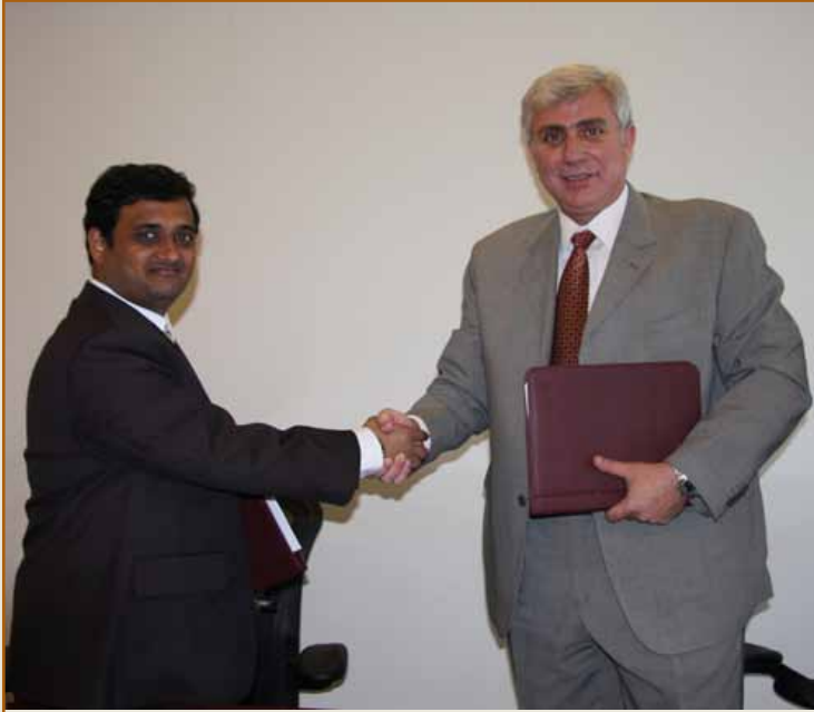
صورتان من التوقيع

كما تنص مذكرة التفاهم على ان تقوم مجموعة ITAD بالتفاوض مع الجامعات الأسترالية المعتمدة بخصوص سبل التعاون مع الجامعة، وإضافة إلى ذلك تنص مذكرة التفاهم على ان تقوم مجموعة ITAD بالبحث عن جهات استرالية تمول برامج لتدريب وبناء قدرات المواطنين غير الأستراليين خارج أستراليا.