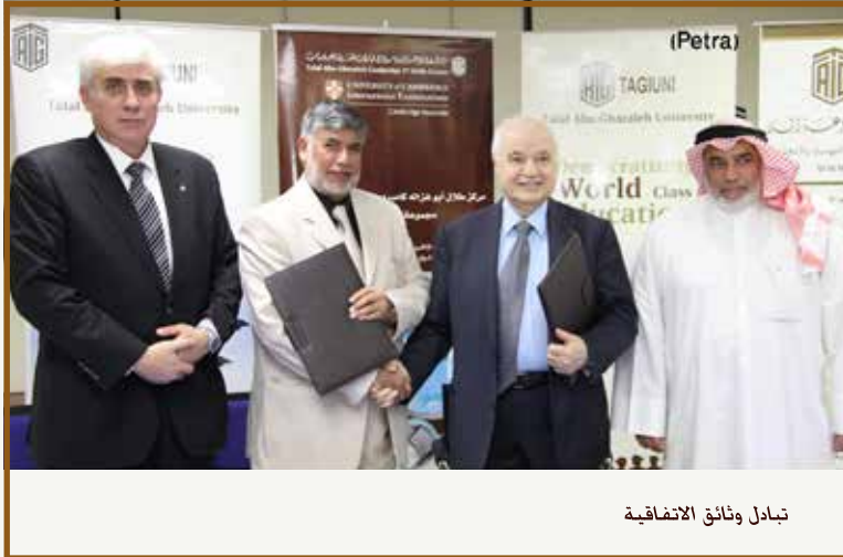
تبادل وثائق الاتفاقية

وقعت في مقر ملتقى طلال أبوغزاله المعرفي اتفاقية شراكة بين الشركة العربية لتقنية المعلومات الدولية أحد شركات مجموعة طلال أبوغزاله وشركة إيه أم أس للدعاية والاعلان ومقرها البحرين. تهدف الاتفاقية الى بناء قاعدة بيانات الكترونية عربية موثقة تشمل كل مواطن في جمع البلدان العربية. وبحيث تحتوي على معلومات شاملة وذات دلالة عن شخصية المواطنين.