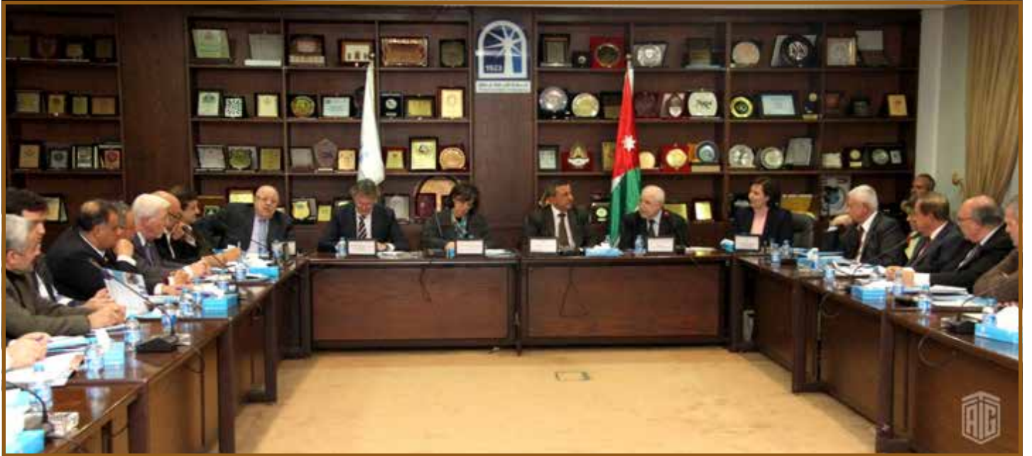
صوره شامله للمشاركين

وأوضح السيد بول فاندل ايجسل سفير هولندا بأن الحكومة الهولندية مهتمة بموضوع المسؤولية الاجتماعية لما لها من تأثير ايجابي على المجتمع والاقتصاد وقال لقد نظمت السفارة بالتعاون