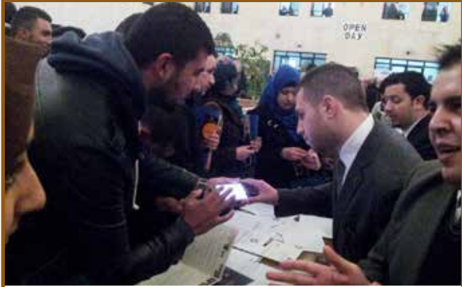
اقبال على جناح المجموعه

شاركت أبوغزاله للتوظيف المهني وتطوير الموارد البشرية وجامعة طلال أبوغزاله والمجمع الدولي العربي للمحاسبين القانونيين في اليوم الوظيفي الذي أقيم في حرم الجامعة الهاشمية. حيث تم التعريف عن خدمات المجموعة والدورات المتاحة وكيفية استفادة الطلاب من هذه الدورات وإرشاد الباحثين عن العمل على الوظائف المتاحة بالمجموعة والعملاء. كما جرى إرشادهم حول كيفية كتابة السيرة الذاتية وإجراء مقابلات العمل. وقد شهد جناح المجموعة إقبالاً كبيراً من الطلبة والحضور الذين حرصوا على التعرف على ما تقدمه المجموعة من خدمات في مجال التوظيف والبحث عن العمل.