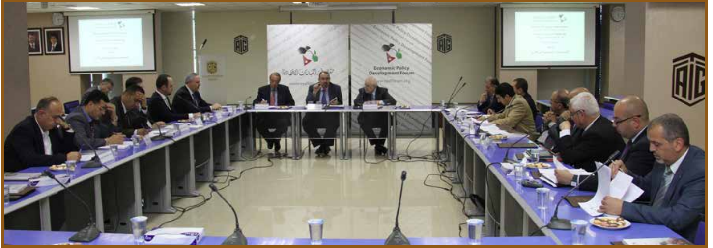
المشاركون في الحوار

وتقليص العجز في الموازنة. مشيراً الى برامج الاصلاح. والتحديات التي تواجه دائرة الضريبة ومنها المتأخرات والتهرب الضريبي.