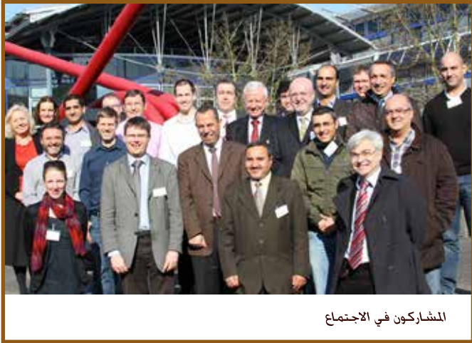
المشاركون في الاجتماع

بون، ألمانيا - شاركت طلال أبوغزاله لتقنية المعلومات الدولية (TAGITI) في الاجتماع التمهيدي لاطلاق مشروع مجتمعات المصادر المفتوحة للبرمجيات (OSSCOM) الذي استضافه قسم علوم الحاسوب في جامعة بون راين زيغ للعلوم التطبيقية ومقرها ألمانيا.