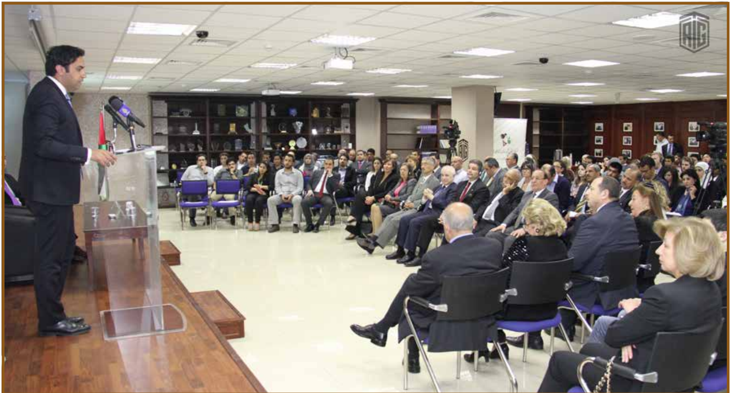
الهنداوي يؤكد التزام الأمم المتحدة بالشباب

وكرر الهنداوي التزام الأمم المتحدة في دعم الشباب وقال أن السيد بان كي مون أكد الى مفهوم العمل مع الشباب وليس من أجل الشباب وبذلك يمكن تحقيق التنمية المنشودة والشاملة.