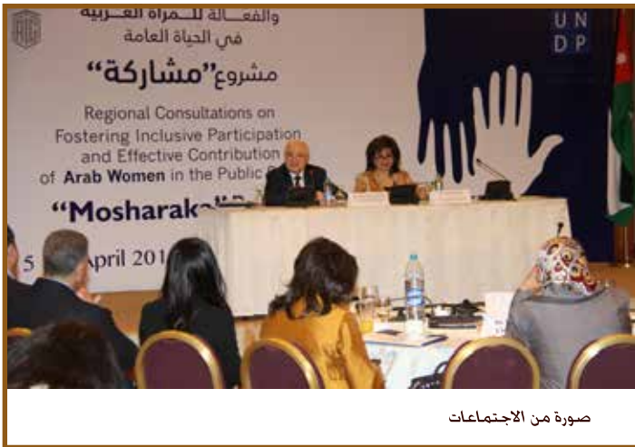
صورة من الاجتماعات

عمّان - نظم المكتب الإقليمي لبرنامج الأمم المتحدة الإنمائي في الدول العربية مشاورة إقليمية رفيعة المستوى في عمان لعرض مبادرة جديدة بعنوان «تعزيز المشاركة الشاملة والفعالة للمرأة العربية في الحياة العامة- مشروع مشاركة». بحضور معالي السيدة ريم أبوحسان وزيرة التنمية الاجتماعية والدكتورة سميرة التويجري المديرية الإقليمية / هيئة الأمم المتحدة للمساواة بين الجنسين وتمكين المرأة ومعالي الدكتورة سيما بحوث الأمين العام المساعد للأمم المتحدة والمديرة الإقليمية لمكتب الدول العربية برنامج الأمم المتحدة الإنمائي ومعالي الدكتور هيفاء أبوغزاليه، الأمين العام المساعد ورئيس قسم الإعلام والاتصال في جامعة الدول العربية.