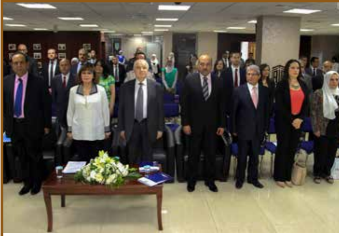
الوقوف اجلالاً للسلام الملكي