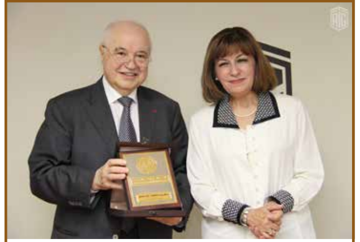
دع الجمع للوزيره