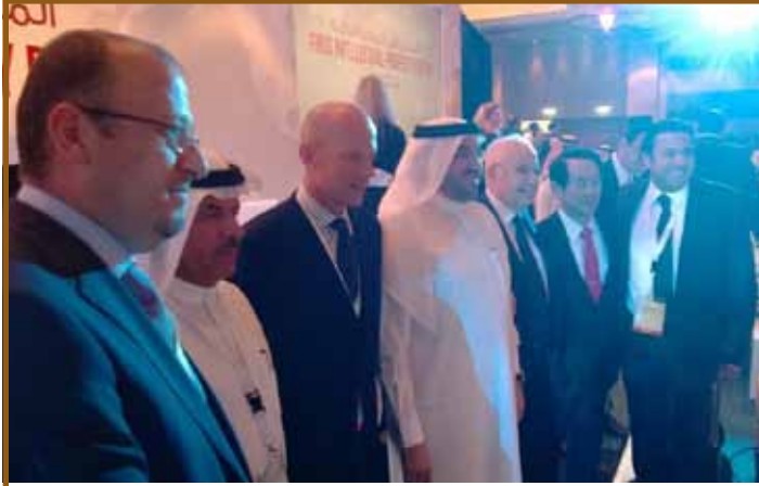
عدد من المشاركين في المنتدى