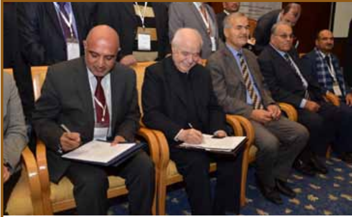
مذكرة تفاهم مع وزارة التعليم العالي - العراقية

إلى الربط مع المنظمة العربية لشبكات البحث والتعليم وكذلك مع الشبكات الإقليمية والأوروبية والأمريكية.