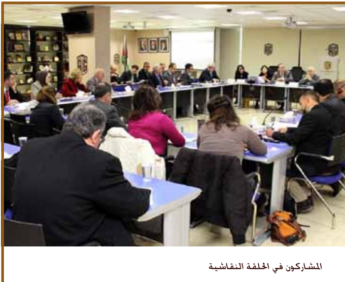
المشاركون في الحلقة النقاشية

وقد تحدث في الاجتماع معالي الدكتور ابراهيم سيف، وزير التخطيط الاردني ومعالي الدكتور عبدالله الدردري، مدير إدارة التنمية الاقتصادية والعولة في اللجنة الاقتصادية والاجتماعية لغرب آسيا «الاسكوا»، وعطوفة الدكتور خالد الوزني، الخبير الاقتصادي، والأستاذة إيمان أبوعطا، مدير جمعية التغيير الاجتماعي من خلال التعليم في الشرق الاوسط، والدكتورة سيمونا مارنيسكو مدير مركز الدولي لبرنامج الأمم المتحدة الائمائي في إسطنبول الذي يعنى بدعم القطاع الخاص. كما شارك في الحوار عدد من السفراء والخبراء. وشارك في الجلسة التي عقدت برئاسة سعادة الدكتور طلال أبوغزالي، رئيس المنتدى كل من عدد من القيادات الحكومية والسلك الدبلوماسي ومنظمات الأمم المتحدة والهيئات الدولية وقادة المجتمع المدني ومثلو القطاع الخاص ووسائل الإعلام. وبعد حوار ومناقشات موضوعية ومعتمقه صدر عن منتدى تطوير السياسات الاقتصادية «إعلان دعم عودة المهجرين السوريين» وتضمن ما يلي: