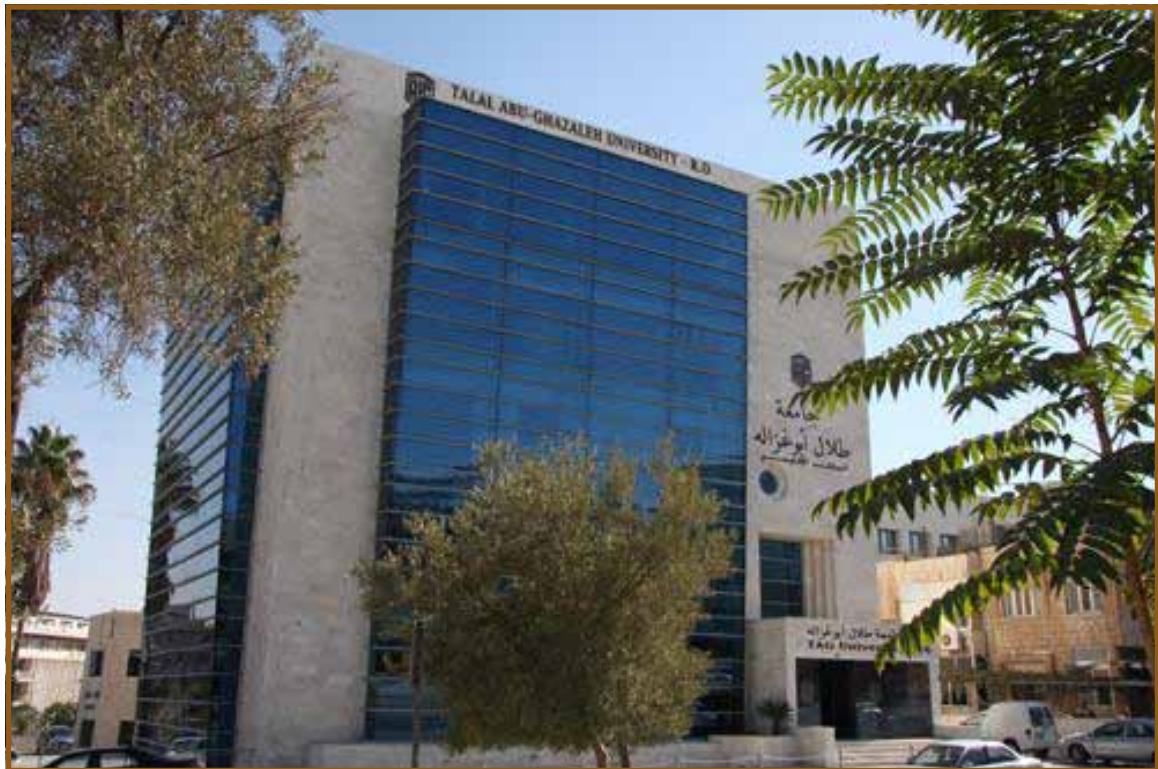
مبنى جامعة طلال أبوغزاله

يذكر أن جامعة طلال أبوغزاله ترتبط باتفاقيات تعاون وشراكة مع عدد من مؤسسات التعليم العالي المرموقة في العالم. وتتيح برامجها الأكاديمية والمهنية عبر الإنترنت للوصول الى أي إنسان في العالم.