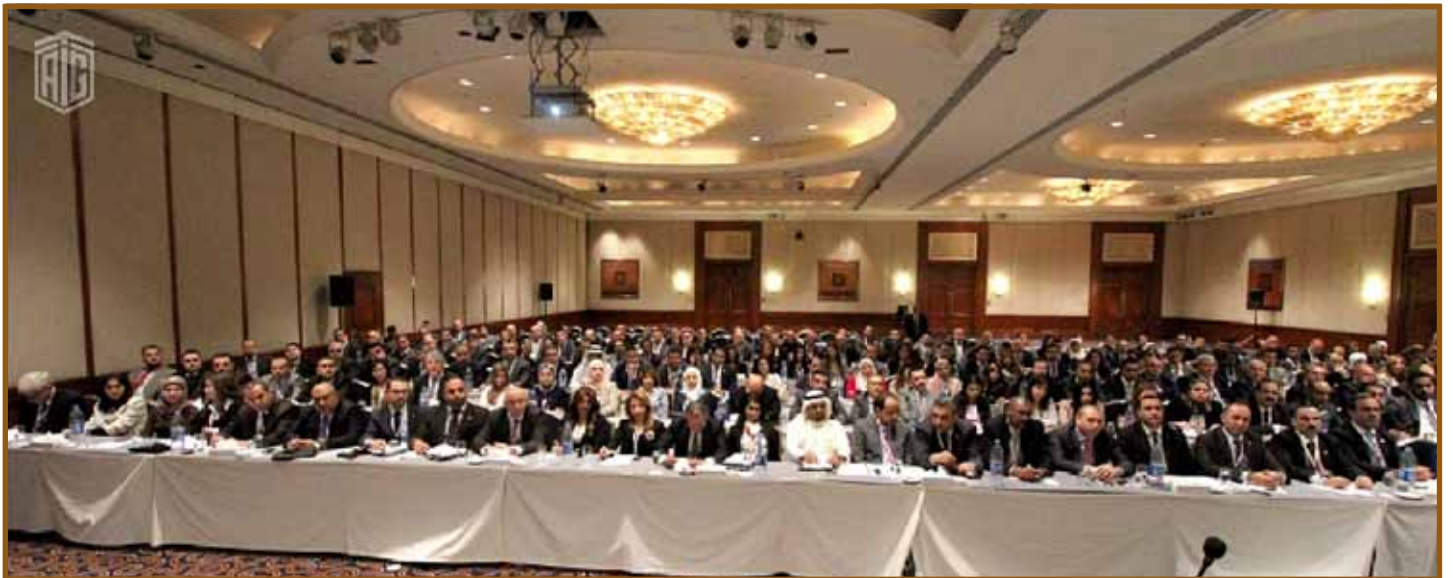
المدراء والموظفون المشاركون في الورشة

وتنفيذاً لهذه الرؤية فقد جرى توزيع المشاركين على عدة فرق عمل كل حسب تخصصه، وأثمر عمل هذه الفرق عن تحديد أهداف للعمل وقدم كل فريق في الجلسة الختامية ما توصل إليه من نتائج وتوصيات وأعلن الدكتور طلال أبوغزاله بأن من بين البرامج الاستراتيجية للمجموعة عام ٢٠٢٢ هو الإنتشار الجغرافي. بحيث يجري افتتاح مكاتب جديدة في أفريقيا وأمريكا اللاتينية، وآسيا وأوروبا لتصبح عدد مكاتب المجموعة مائة مكتب حول العالم.