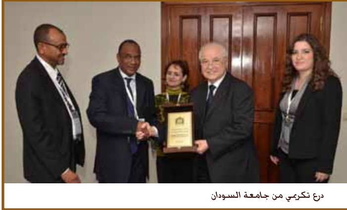
درع تكريمي من جامعة السودان

كما تقرر عقد المؤتمر السادس في سلطنة عُمان تحت شعار «أتماط التعليم ومعايير الرقابة على الجودة فيها» بحيث يكون أحد محاور المؤتمر حول التعليم الرقمي.