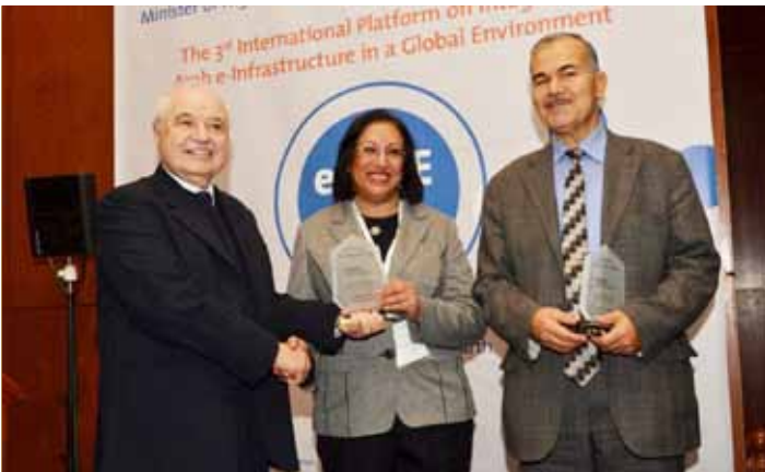
الوزير التونسي، السفيرة فائقة الصالح، د. أبوغزاله

تونس - استقبل معالي الدكتور منصف بن سالم وزير التعليم العالي والبحث العلمي في الجمهورية التونسية سعادة الدكتور طلال أبوغزاله رئيس المنظمة العربية لضمان الجودة في التعليم، وتركز البحث خلال الاجتماع على برامج وأنشطة المنظمة لتطوير شبكة عمل من أجل ضمان الجودة في التعليم.