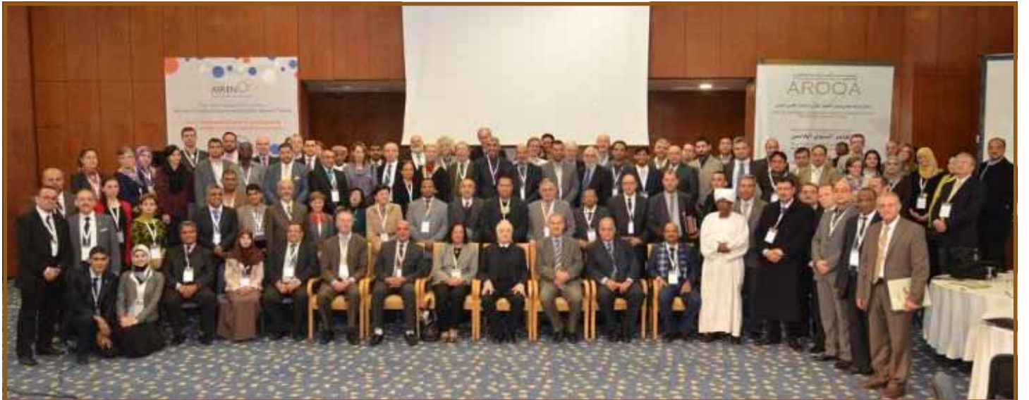
الوفود العربية والأجنبية

وقررت الجمعية العامة تكليف جامعة القدس المفتوحة لإعداد مسودة معايير ومؤشرات جودة التعليم. لیتم بعدها تعيين هيئة الإعتاماد من خبراء الجودة العرب لمراجعتها وإعتمادها ومن ثم العمل بها.