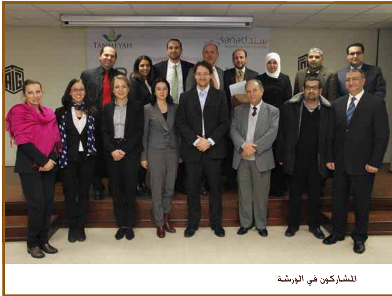
المشاركون في الورشة

عمان - استضاف ملتقى طلال أبوغزاله المعرفي ورشة عمل بعنوان "نماذج النمو المسؤول في التمويل الأصغر ضمن بيئة تنافسية" نظمتها شبكة مؤسسات التمويل الأصغر في الأردن- تنمية بالتعاون مع صندوق سند لتمويل المشاريع المتناهية الصغر والصغيرة والمتوسطة في ملتقى طلال أبوغزاله المعرفي. بمشاركة عدد من ممثلي المؤسسات الحكومية المعنية، والبنك المركزي الأردني، ووكالات التنمية، ومؤسسات التمويل الأصغر وخبراء دوليين لمناقشة الوضع القائم والتطورات المستقبلية في قطاع التمويل الأصغر في الأردن. وتم التركيز أيضا على الجهود المبذولة من قبل الحكومة الأردنية ممثلة بوزارة التخطيط والتعاون الدولي الهادفة لتنفيذ استراتيجية التمويل الأصغر والمعدة بدعم من قبل بنك التنمية الألماني (KfW) والمؤسسة الألمانية للتعاون الدولي (GIZ).