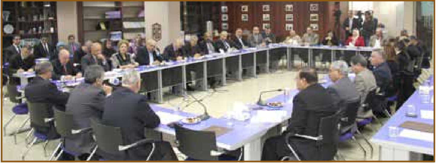
لقطة شاملة للحضور

وأكد أنه وبغض النظر عما هو متوقع من حصول خزينة الدولة على منح ومساعدات. فإنه لا بد من تخصيص النفقات العامة للدولة بناء على الإيرادات المحلية المتوقعة.