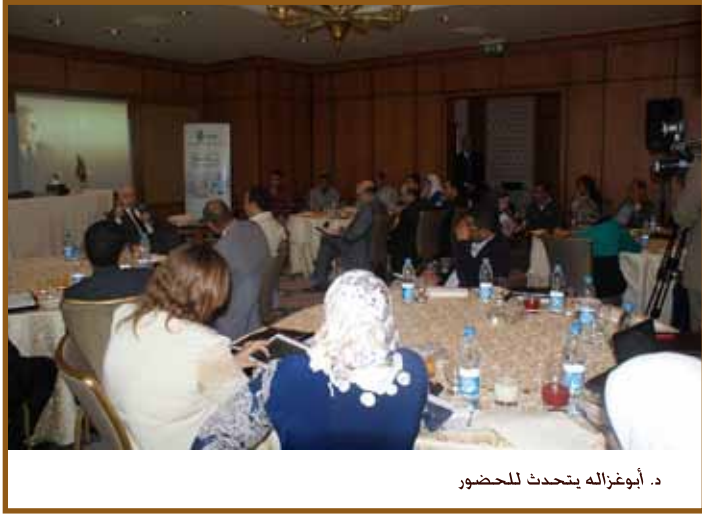
د. أبوغزاله يتحدث للحضور

القاهرة - أعلن سعادة الدكتور طلال أبوغزاله عن سلسلة من المشاريع والبرامج في مجال البحث العلمي وتقنية المعلومات التي تعتزم مجموعة طلال أبوغزاله تنفيذها في مصر خلال الفترة المقبلة.