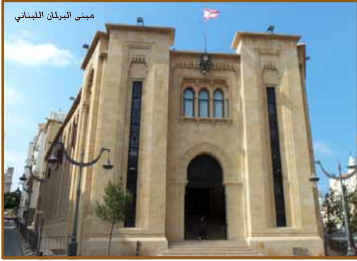
مبنى البرلمان اللبناني

رابعا: تعزيز الدور المؤسساتي للبرلمان وبالتالي تطوير وتنفيذ استراتيجية تكنولوجيا المعلومات والاتصالات وتحديث الموقع الإلكتروني الخاص بالبرلمان اللبناني وتعزيز وتنفيذ برنامج تعريفي للنواب الجدد والنواب المعاد انتخابهم.