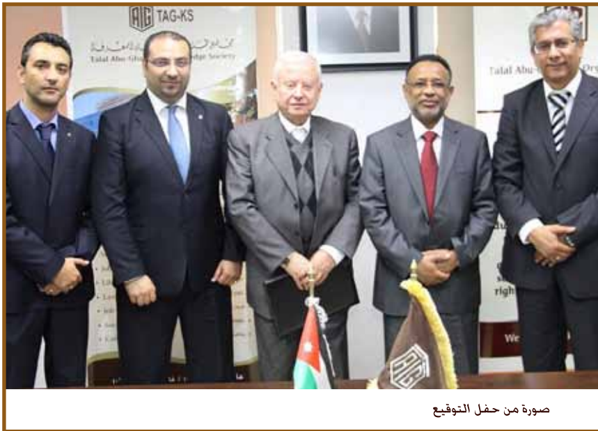
صورة من حفل التوقيع

عمان - وقع مجتمع طلال أبوغزاله للمعرفة وجامعة الغرير في دبي اتفاقية تعاون في مجال شهادات دبلوم التدريب المهني تقضي بتزويد وتسويق برامج تدريبية وتوفير مدربين من ذوي المهارات المهنية العالية.