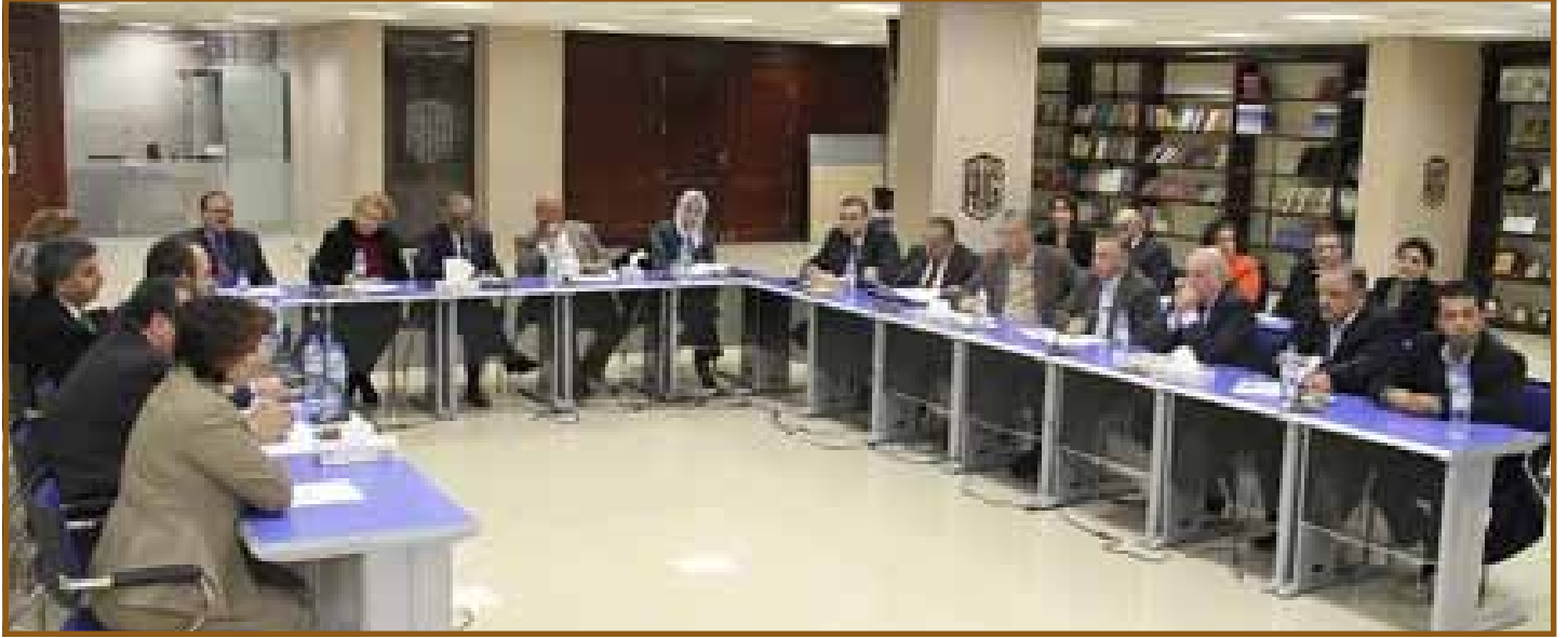
مشاركون في الحوار

مراجعة كفاءة وفعالية السياسات والعمليات والإجراءات التي تدعم الحوكمة وخاصة المؤسسات المعنية بالرقابة المالية والإدارية ومكافحة الفساد مثل ديوان المحاسبة. دائرة الموازنة العامة... الخ. دعم الإصلاحات التشريعية وتعزيز كفاءة الجهاز التشريعي والقضائي والرقابي وردم الهوة بين نصوص القوانين والتطبيق الفعلي لها. وتفعيل قانون ضمان حق الحصول على المعلومات. تعزيز ثقافة الامتثال الضريبي والافصاح والشفافية وتنفيذ التشريعات الضريبية بعدالة ورفع كفاءة الجهاز الضريبي وعمليات التحصيل. وتعزيز دور المحكمة الدستورية. مراقبة أداء البرامج الحكومية وأوجه الانفاق ضمن منهجية واضحة للمتابعة والتقييم. وتعزيز قدرات موظفي الرقابة المالية والإدارية وكذلك القائمين على أعمال التدقيق الداخلي. دعم الاطار المؤسسي والخطة الاستراتيجية والقدرات المحلية بهدف تحسين فعالية ادارة مؤسسات القطاع العام.