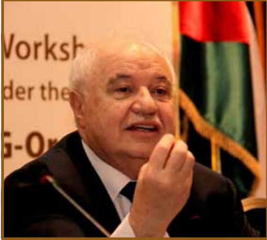
د. أبوغزاله: خيارنا التطوير والتنمية

عمان - عقدت مجموعة طلال أبوغزاله ورشة عمل على مدار يومين في عمان بعنوان TAG-Org 2022 - تطوير .. إصلاح .. تنمية برئاسة سعادة الدكتور طلال أبوغزاله وبمشاركة مدراء ورؤساء الدوائر من جميع مكاتب المجموعة الثمانين حول العالم.