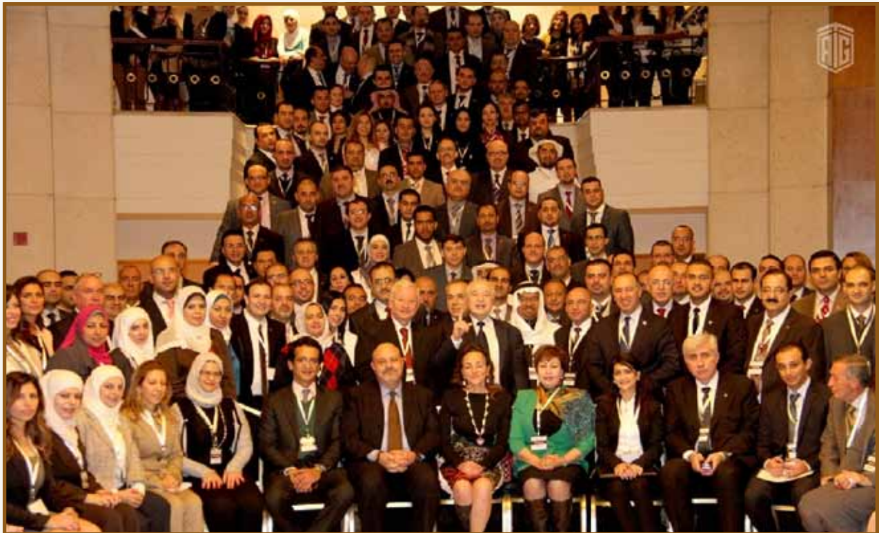
صورة تذكارية للمشاركين