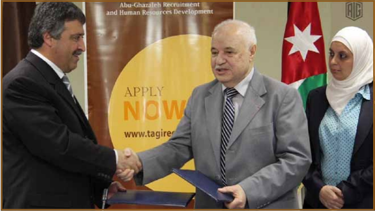
د. أبوغزاله والوزير قطامين يتبادلان وثائق المذكرة

المذكرة التي نوقعتها اليوم تفتح أمامنا أبواب وآليات للعمل مؤكداً على تعاون المجموعة مع مختلف الجهات المعنية لتدريب الباحثين عن عمل وتأهيلهم وتوفير الدعم اللازم والحوافز المشجعة لهم وتسخير كافة كوادر المجموعة للتعاون مع وزارة العمل لخدمة الوطن والمواطنين.