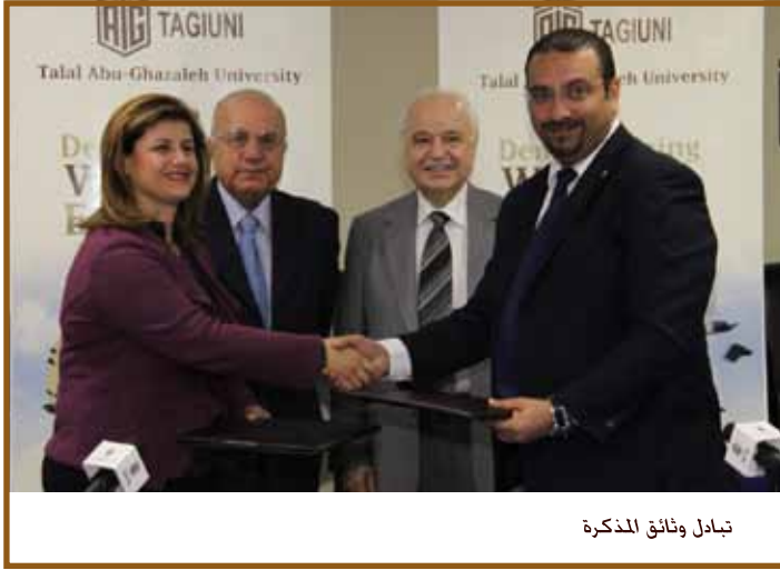
تبادل وثائق المذكرة