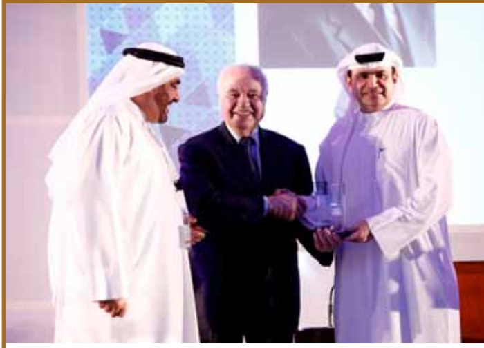
دع جامعة حمدان بن محمد الذكية

للسحابة الإلكترونية في المنطقة العربية، وإجاز يهدف إلى إيجاد مجمع لمصادر تقنية المعلومات الكبيرة، وتدعم السحابة البرامج الأكاديمية لجامعة طلال أبوغزاله.