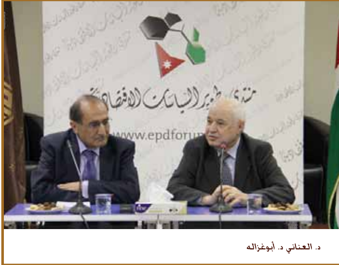
د. العناني د. أبوغزاله

عمان - نظم منتدى تطوير السياسات الاقتصادية في ملتقى طلال أبوغزاله المعرفي جلسة نقاشية بعنوان الحاجة الى خطة اقتصادية استراتيجية تحدث فيها معالي العين الدكتور جواد العناني.