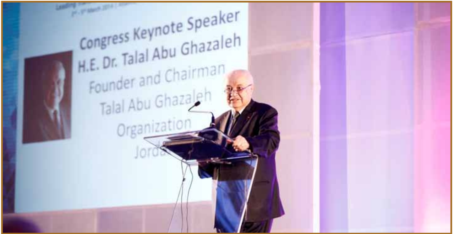
أبوغزاله يحذر من تسونامي التعليم

أكد سعادة الدكتور طلال أبوغزاله بأن التقنية كانت وما تزال عاملاً رئيسياً في تطوير التعليم، وهي بمثابة قطار شحن لا يمكن إيقافه، وعلينا أن نتأقلم معها ونعتمد عليها إذا أردنا مواكبة العصر.