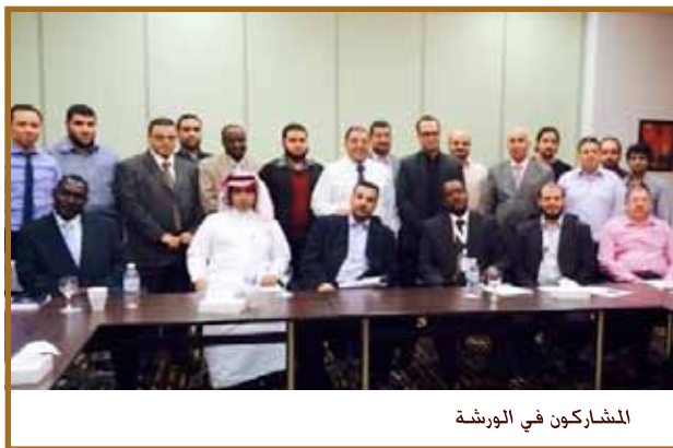
المشاركون في الورشة

كما اقترح الدكتور طلال أبوغزاله فكرة انضمام ليبيا لبرنامج «الأورومتوسطي ٢٠٣٠» والذي يعمل على تفعيل دور الاقتصاد في العالم للعام ٢٠٣٠، وترشيح عدد من المراكز البحثية الاقتصادية للانضمام وتمثيل ليبيا في هذا البرنامج الهام، وتم اقتراح إقامة مركز للبحث العلمي في جامعة بنغازي.