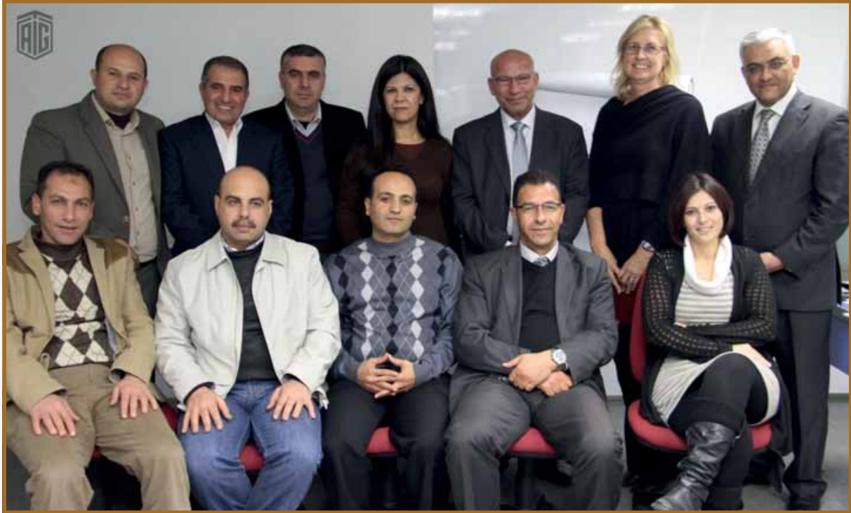
عدد من المشاركين في الدورة

وفي ختام الدورة تم تسليم المشاركين شهادة مشاركة من مجموعة طلال أبو غزاله للتدريب المهني.