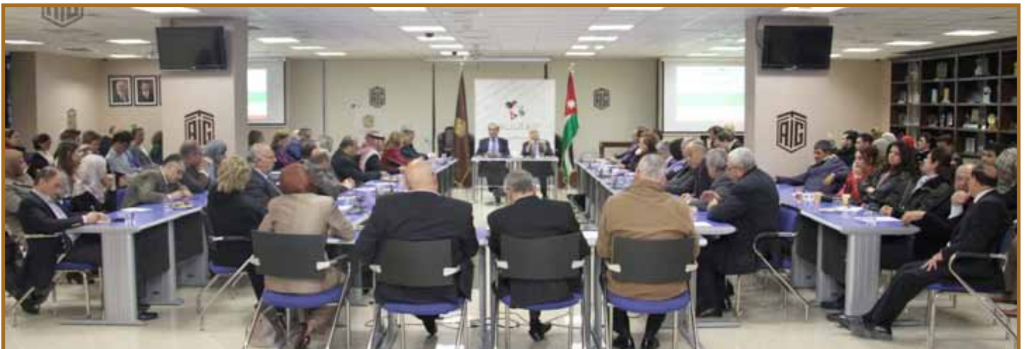
المشاركون في الجلسة

وخلص الحضور الى الطلب من رئيس المنتدى تشكيل فريق عمل برئاسته لصياغة رؤية مستقبلية للأردن الذي نريد في العيد السنوي للوطن عام ٢٠٢٢. بحيث ترفع هذه الرؤية الى جلالة الملك المعظم ليقرر سيد البلاد ما يراه بشأنها.