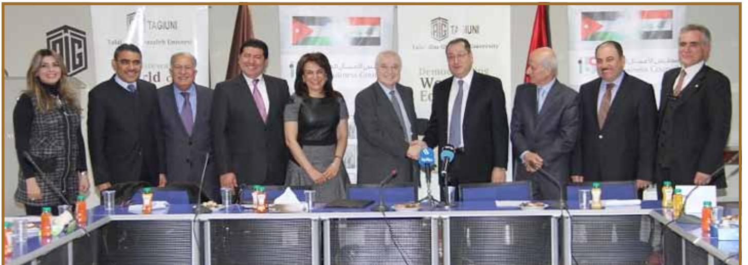
أعضاء مجلس الأعمال العراقي