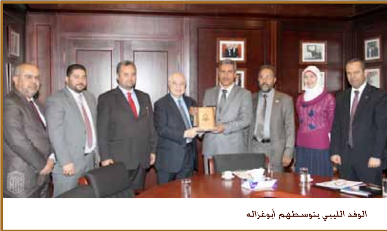
الوفد الليبي يتوسطهم أبوغزاله

عمان - استقبل سعادة الدكتور طلال ابوغزاله رئيس المنظمة العربية لشبكات البحث والتعليم الدكتور بشير اشتوي وكيل وزارة التعليم العالي والبحث العلمي في ليبيا والوفد المرافق وجرى في الاجتماع بحث افاق التعاون حول تأسيس شبكة البحث والتعليم الوطنية الليبية.