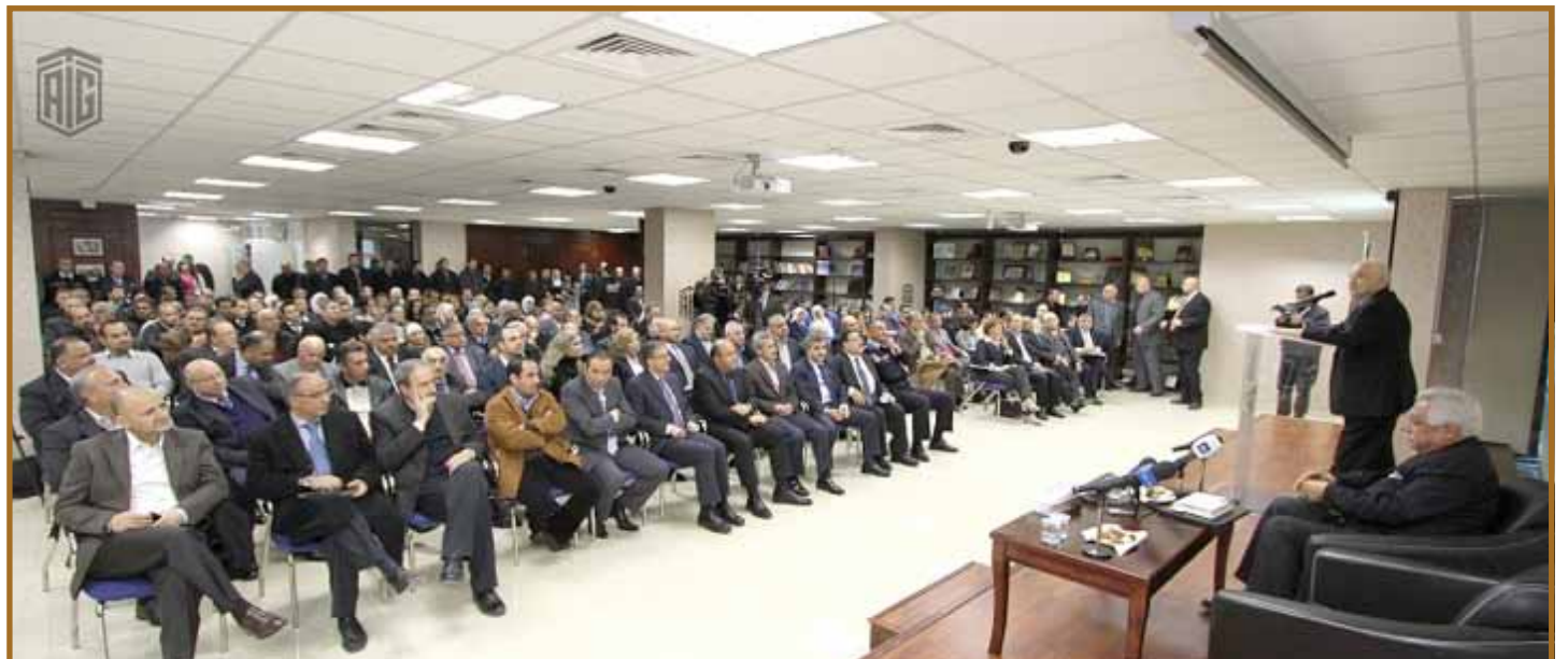
الشخصيات المشاركة في الحوار

موضحا أن مديونية الأمانة التي تصل الى ٢٥٠ مليون دينار. تقابلها مبالغ مالية مستحقة للأمانة على الحكومة والمواطنين ستنعكس حال تسديدها مشاريع وخدمات للمواطنين. وتابع