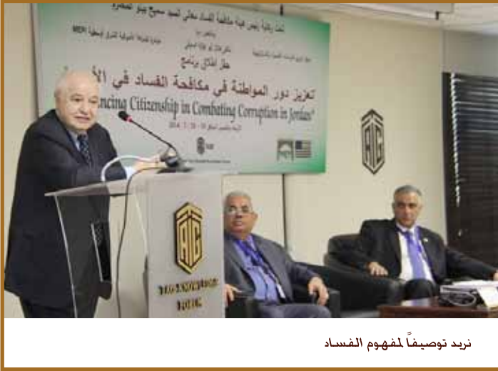
نريد توصيفاً لمفهوم الفساد

بمشاركة ممثلي ثلاثون مؤسسة من مؤسسات المجتمع المدني استضاف ملتقى طلال ابوغزاليه المعرفي برنامجاً تدريبياً حول تعزيز دور المواطنة في مكافحة الفساد في الأردن.