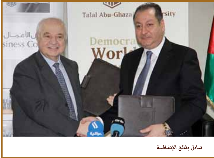
تبادل وناثق الإتفاقيه

مفيدة لجميع أعضاء مجلس الأعمال كما تحمل آفاقاً كبيرة لخدمة الاقتصاد العراقي.