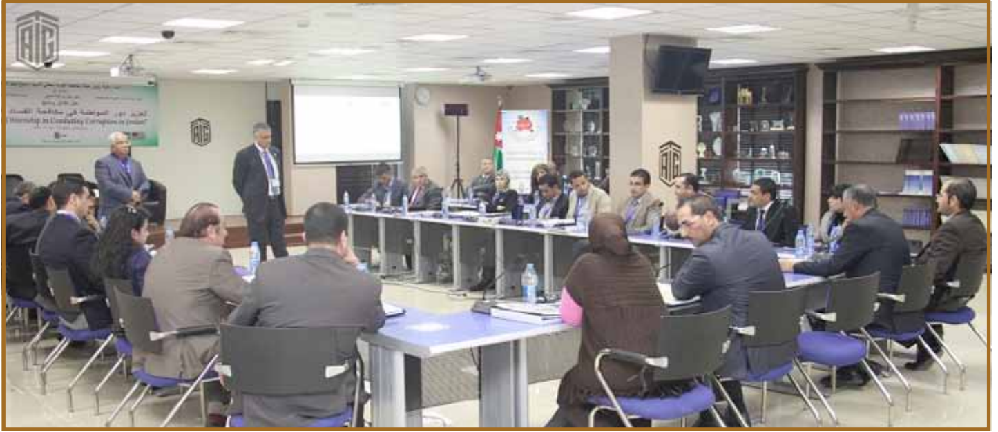
المشاركون في البرنامج