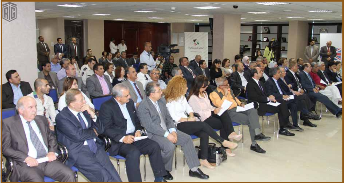
المشاركون في المناسبة