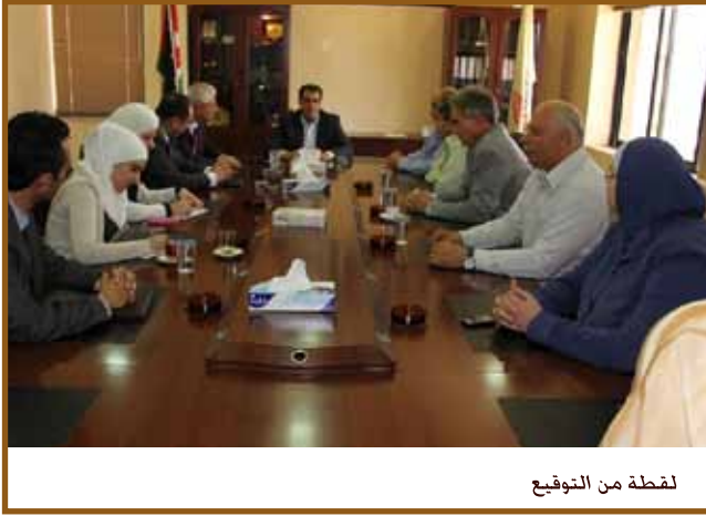
لقطة من التوقيع

عمان - وقع مركز طلال أبوغزاله للمعرفة ونقابة صيادلة الأردن مذكرة تفاهم من أجل تعزيز التعاون بينهما فيما يتعلق بنشاطات وخدمات التدريب.