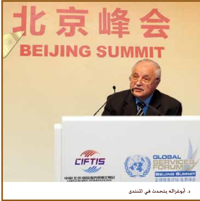
د. أبوغزاله يتحدث في المنتدى

بكين - أكد سعادة الدكتور طلال أبوغزاله، رئيس مجموعة طلال أبوغزاله أن القيود المفروضة على الاستيراد قد تكون هي ذات الوقت قيودا على التصدير. وأشار إلى أن التنوع في الخدمات تساهم في إعطاء قيمة لتطوير المنتجات وصناعاتها، وهذا يقدم فرصا للأعمال لتطوير نشاطاتها في العديد من قطاعات الصناعة التي تدعم قطاع التصنيع بحد ذاته.