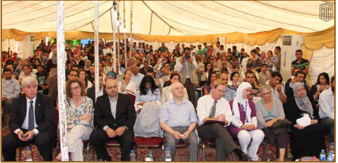
صورة من الحفل