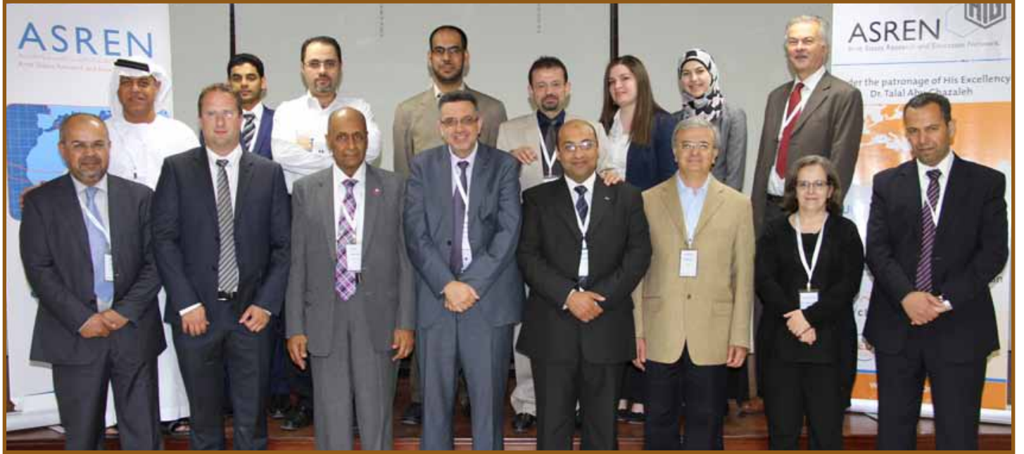
المشاركون في الاجتماع

بعض المناطق إلى ربط متخصص بسرعة 200 غيغابايت بالثانية للبحث والتعليم. ولا يزال العالم العربي يفتقر إلى ربط أساسي وبالكاد وصل إلى ربط دولي متخصص بسرعة نصف غيغابايت في الثانية.