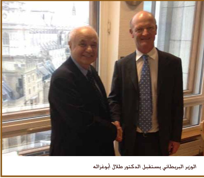
الوزير البريطاني يستقبل الدكتور طلال أبوغزاله

وَجَدَرُ الإِشَارَةُ إِلَى أَنَّ جَامِعَةَ طَلَالِ أَبُوغَزَالِهِ قَدْ وَقَعَتْ اتِّفَاقِيَّاتٍ تَعَاوَنَ مَعَ عِدَّةٍ مِنَ الْجَامِعَاتِ الْبَرِيطَانِيَّةِ لِاسْتِقْطَابِ الطُّلُبَةِ عَلَى مَسْتَوَى الْعَالَمِ لِلدِّرَاسَةِ الرَّقْمِيَّةِ لَدَيْهَا وَمَازَالَتْ فِي تَوَاصُلٍ مَعَ الْعَدِيدِ مِنْهَا لِتَشْمَلَ كُلَّ الْبُرَامِجِ التَّعْلِيمِيَّةِ الْإِلِكْتُرُونِيَّةِ الْجَامِعِيَّةِ وَعَلَى قَدَمِ الْمَسَاوَاةِ مَعَ الْجَامِعَاتِ الْأَمْرِيكِيَّةِ وَغَيْرِهَا مِنَ الْجَامِعَاتِ الْمَعْتَرَفِ بِهَا دَوْلِيًّا.