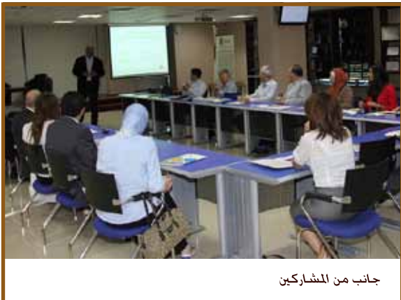
جانب من المشاركين

عمان - نظم مركز حوكمة الشركات العائلية محاضرة في منتدى طلال أبوغزاليه المعرفي بعنوان «الهياكل العائلية» تحدث فيها السيد لؤي أبوغزاليه، مؤسس مركز حوكمة الشركات العائلية، بحضور أعضاء مركز ورجال أعمال وعدد من القطاعات المهمة في حقل الشركات العائلية وتناولت المحاضرة بشكل مفصل خبرات وخارج العائلات في إنشاء وتأسيس هياكلها الخاصة في إدارة الأعمال.