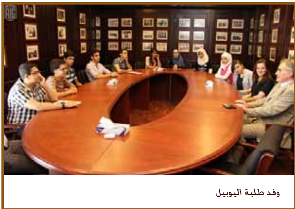
وفد طلبة اليوبيل

وأضاف: «اجتذب موقع إعرز طلبة من 21 دولة من مختلف أنحاء العالم، ونأمل من خلال هذه الشراكة توسيع نطاق انتشارنا ومشاركة الموسيقى الشرقية مع جميع أولئك الذين تأسروهم أسلوبها الفريد.»