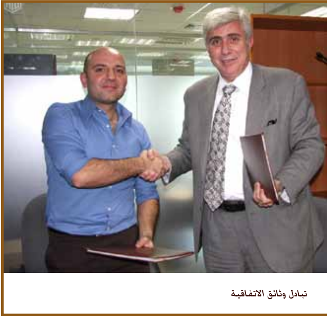
تبادل وثائق الاتفاقية

عمان - وقعت جامعة طلال أبوغزاله اتفاقية شراكة مع موقع إعرز للموسيقى. وهي مدرسة لتعليم الموسيقى عبر الإنترنت تقدم دروساً ذاتية بغرض ترويح تعلم الموسيقى إلكترونياً.