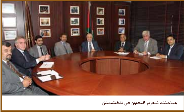
مباحثات لتعزيز التعاون في أفغانستان

وهناك العديد من المشاريع الأخرى المتعلقة بالتنمية الإقتصادية والإجتماعية وبناء القدرات التي يستعد مكتب المجموعة في كابول لتنفيذها بالتعاون وبتمويل هيئات دولية ومن هذه المشاريع: إعداد خارطة طريق لتنمية وطنية مستدامة، خدمات قانونية لإعادة إعمار أفغانستان، إعداد خارطة الطريق لتطوير نظام المعونة الوطنية المستدامة، تقييم برامج تحسين جودة التعليم وتحسين بيئة الأعمال في مؤسسة المناجم وأخرى لشبكة المياه والكهرباء، وتعكف المجموعة على إعداد خطة إستراتيجية شاملة والتواصل مع وزارة الخدمات لتغطية كافة الخدمات المهنية بما في ذلك بناء قدرات المجتمعات المحلية وخاصة الريفية وتنفيذ برامج متخصصة تساهم في تحقيق التنمية المستدامة.