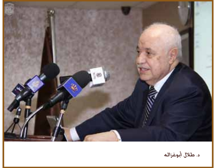
د. طلال أبوغزاله

ونتيجة لذلك وضعت كل دولة استراتيجية خاصة بها لتطبيق التعليم بمساعدة تكنولوجيا المعلومات والاتصالات بناء على السياق الخاص بكل منها. باستثناء فلسطين. فإن التعليم بمساعدة الحاسوب يمنح أولوية بشكل كبير ويعكس أهميته الحالية في وضع السياسات في حين أن الأردن وسلطنة عمان أفضل حظاً من حيث البنية التحتية.