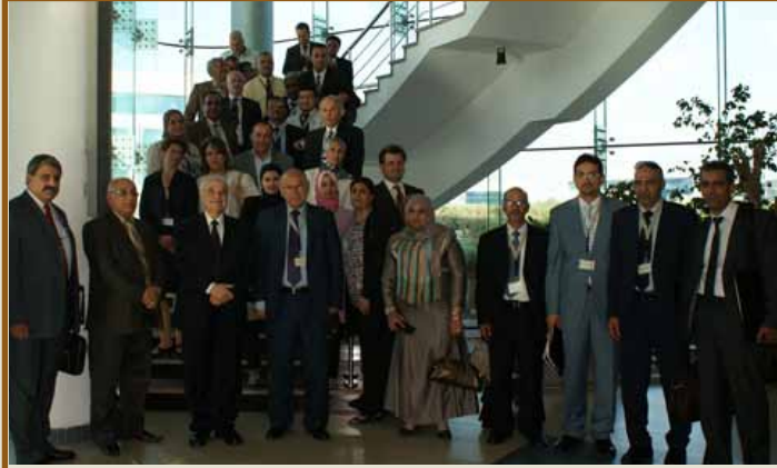
عدد من المشاركين في المؤتمر