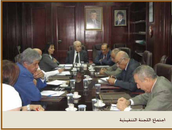
اجتماع اللجنة التنفيذية

عمان - عقدت اللجنة التنفيذية لمنتدى تطوير السياسات الاقتصادية اجتماعها الدوري يوم ٦ أيلول ٢٠١٢ برئاسة الدكتور طلال أبوغزاله رئيس المنتدى.