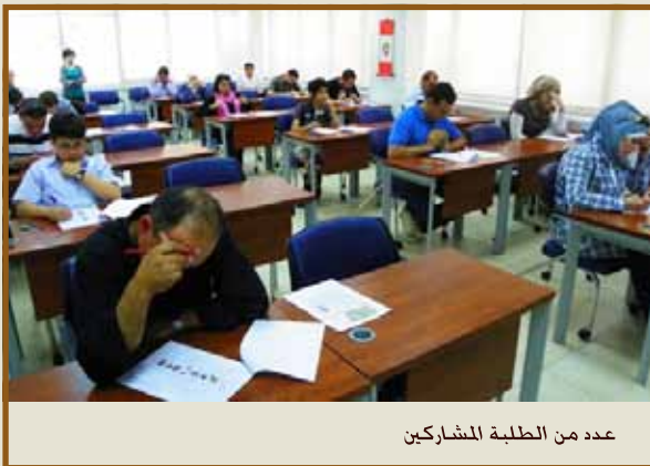
عدد من الطلبة المشاركين

عمان - أعلن معهد طلال أبوغزاله - كونفوشيوس، وهو مركز الامتحانات الرسمي لاختبار الكفاءة الصيني (HSK) عن البدء في دورات جديدة للغة الصينية لجميع المستويات.