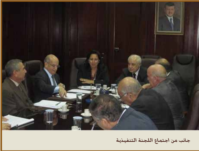
جانب من اجتماع اللجنة التنفيذية

على صعيد آخر عرض رئيس المنتدى فكرة وأهمية الميثاق الاقتصادي الأردني في دعم وتعزيز التنمية الاقتصادية. بحيث يتركز التوجه لإنشاء مؤسسة دائمة للميثاق تضع السياسات وتشكيل فريق عمل لها لمتابعة ما يتضمنه الميثاق والسهر على تنفيذه.