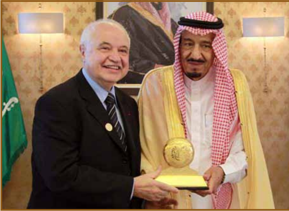
جائزة الأمير سلمان لشباب الأعمال

جدة- في حفل أقيم في مقر وزارة الدفاع في جدة تفضل صاحب السمو الملكي الأمير سلمان بن عبدالعزيز ولي العهد نائب رئيس مجلس الوزراء وزير الدفاع، بتكريم سعادة الدكتور طلال أبوغزاله، وسلمه من يده الكريمة جائزة الأمير سلمان لشباب الأعمال، وذلك تقديراً لدور مجموعة طلال أبوغزاله في دعم مؤسسة الجائزة وشباب الأعمال.