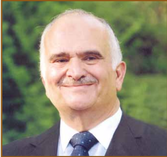
صاحب السمو الملكي الأمير الحسن بن طلال

عمان، تفتتح جامعة طلال أبوغزاله أبوابها يوم الثامن عشر من تشرين أول - أكتوبر المقبل باستضافة صاحب السمو الملكي الأمير الحسن بن طلال للتحاور مع الشباب في جلسة حوارية بعنوان الشباب والانتقال إلى المعرفة، وسيتمتع سموه بافتتاح الجامعة.