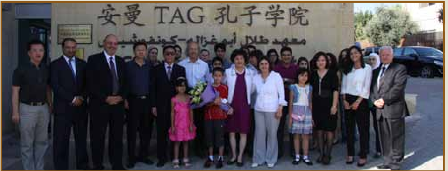
زيارة الوفد لمعهد طلال أبوغزاله كونفوشيوس

وفي حفل تكريمها بحضور عدد من أعضاء العائلة الملكية والوزراء ومجلسي النواب والأعيان. قال الدكتور طلال أبوغزاله: «نحن نفتخر بعلاقتنا المتميزة مع الحكومة والمؤسسات الصينية، وما زال في كنفنا العديد من الأفكار التي يمكننا التعاون بها في العديد من المجالات وبالأخص في مجال التعليم الإلكتروني. ونتطلع لمشاركة الصين في مشاريع أخرى جديدة».