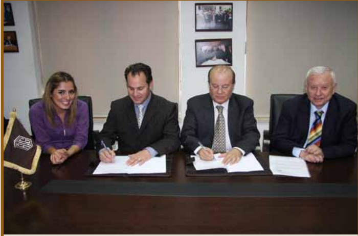
لقطة من توقيع الإتفاقية

عمان، وقعت جامعة طلال أبوغزاله (TAGIUNI)، الشريك التعليمي العالمي للتعليم عن بعد، اتفاقية تعاون مع الشركة الإقليمية للتعليم الإلكتروني (EDRC) بغرض توصيل مناهج إلكترونية باللغة الإنجليزية إلى الهيئة الطلابية العالمية.