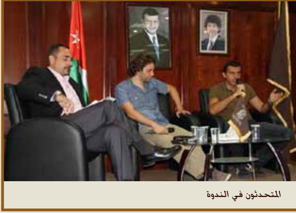
المتحدثون في الندوة

عمان - نظم ملتقى طلال أبوغزاله للأعمال ندوة مشوّقة بعنوان «المشروع الريادي الاجتماعي: نطاق» التي ركّزت على دور الرواد الشباب في مساعدة المجتمع من خلال تبني مبادرات مختلفة.