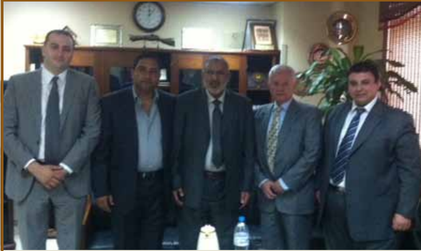
من حفل التوقيع

عمان - وقعت شركة أبوغزاله وشركاه للاستشارات اتفاقية مع مستشفى الأسراء تهدف الى اعادة هيكلة جميع دوائر واقسام المستشفى (نظام الموارد البشرية - دليل سياسات واجراءات العمل).