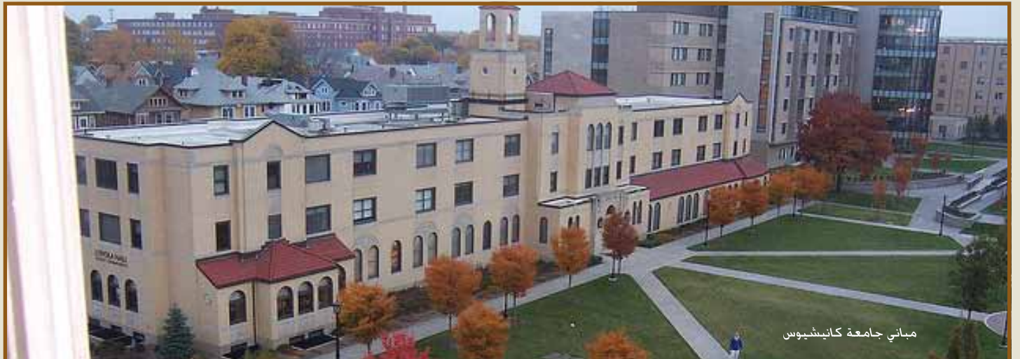
مباني جامعة كانيسوس

وسيتم منح الدرجات والشهادات من قبل جامعة كانيسوس