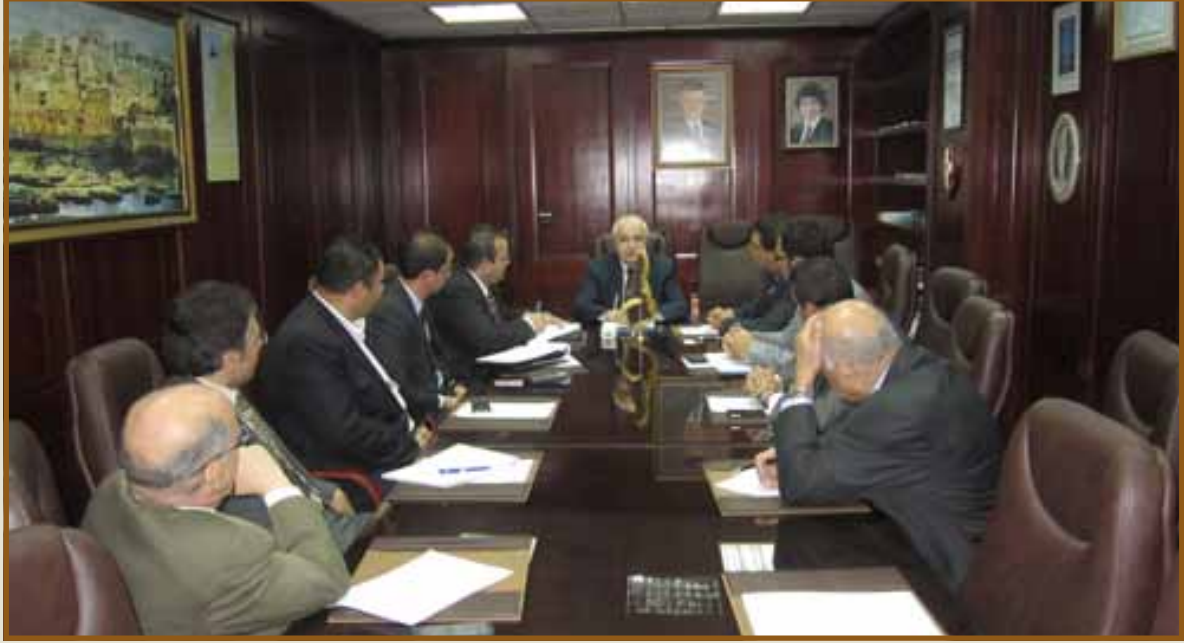
د. أبوغزاله يترأس اجتماعاً لفريق العمل

عمان - لمواكبة التطورات المتسارعة في عالم تقنية المعلومات والاتصالات، وما تحدثه من تحولات كبيرة في قطاعات الأعمال والخدمات وفي القطاعات الأخرى، عملت مجموعة طلال أبوغزاله على إطلاق خدمة استشارات الحوسبة السحابية (TAG Cloud Computing) بهدف إيصال أحدث تقنيات الحوسبة لكافة قطاعات الأعمال والخدمات في القطاعين العام والخاص للمنطقة العربية.