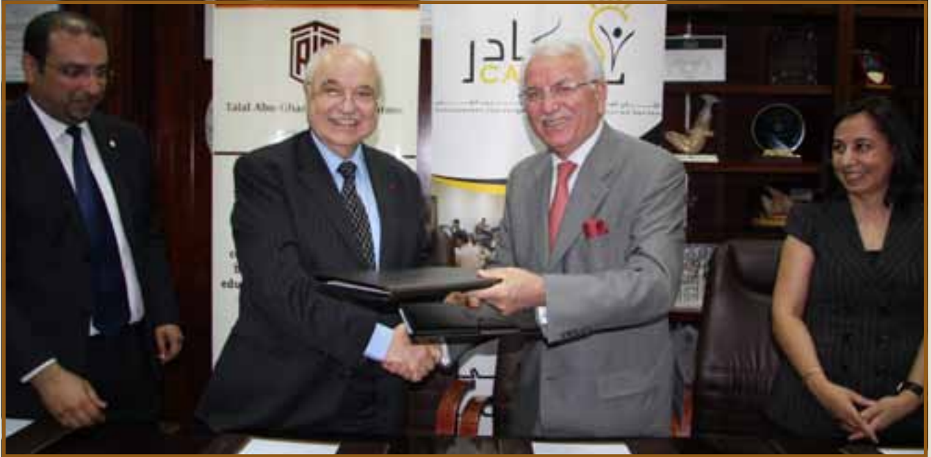
د. طلال أبوغزاله و د. محي الدين توك يتبادلان وثائق الإتفاقية

مبتكراً في المنطقة وعملت على تمكين الآلاف من التريبيين وأكد أنه من خلال هذه الشراكة سيستفيد الكثير من الأردنيين وغيرهم من العرب.