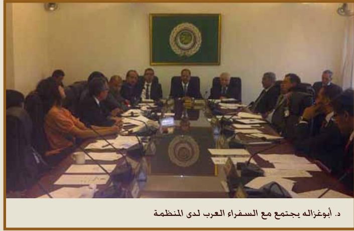
د. أبوغزاله يجتمع مع السفراء العرب لدى المنظمة

على صعيد آخر اطلع الدكتور طلال أبوغزاله السفراء العرب لدى المنظمة على سير عمل اجتماعات فريق الخبراء واقتراحاته وتصورات مستقبل التجارة العالمية، ومواجهة التحديات، وذلك في الاجتماع الذي عقده السفراء العرب في مقر وفد جامعة الدول العربية في جنيف بدعوة من الدكتور عبدالعزيز بن شافي العتيبي سفير المملكة العربية السعودية ومنسق المجموعة العربية.