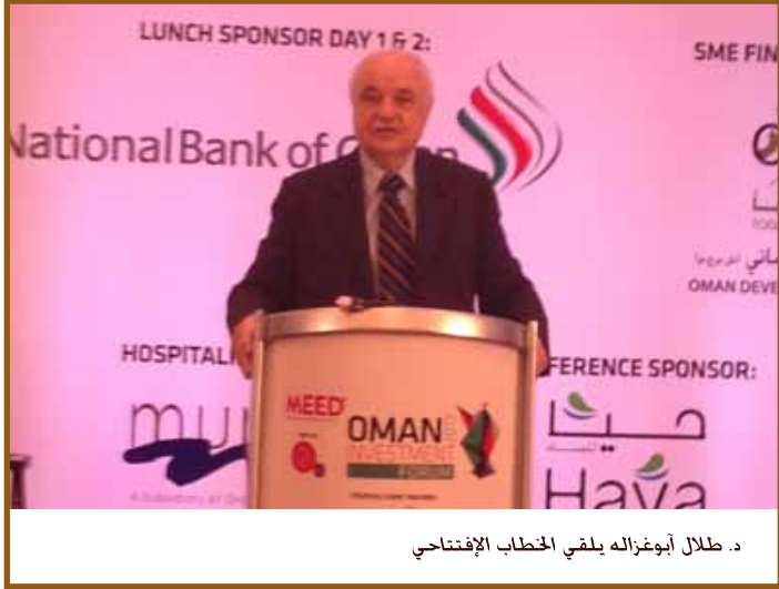
د. لائل أبوغزاله يلقي الخطاب الافتتاحي

مسقط - شارك الدكتور لائل أبوغزاله، رئيس مجموعة لائل أبوغزاله وعضو لجنة خبراء منظمة التجارة العالمية حول «تحديد مستقبل التجارة»، في ملتقى عُمان للاستثمار الذي عقد في قصر البستان، ريتز كارلتون في مسقط.