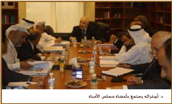
د. أبوغزاله يجتمع بأعضاء مجلس الأمناء

المنامة - عقد مجلس أمناء كلية طلال أبوغزاله الجامعية - البحرين أول اجتماع له في المنامة بعد مباشرة الدراسة في الكلية. وقبل الإجتماع استقبل الدكتور طلال أبوغزاله أعضاء المجلس وشكرهم على تلبية الدعوة وقبول المشاركة في عضوية المجلس.