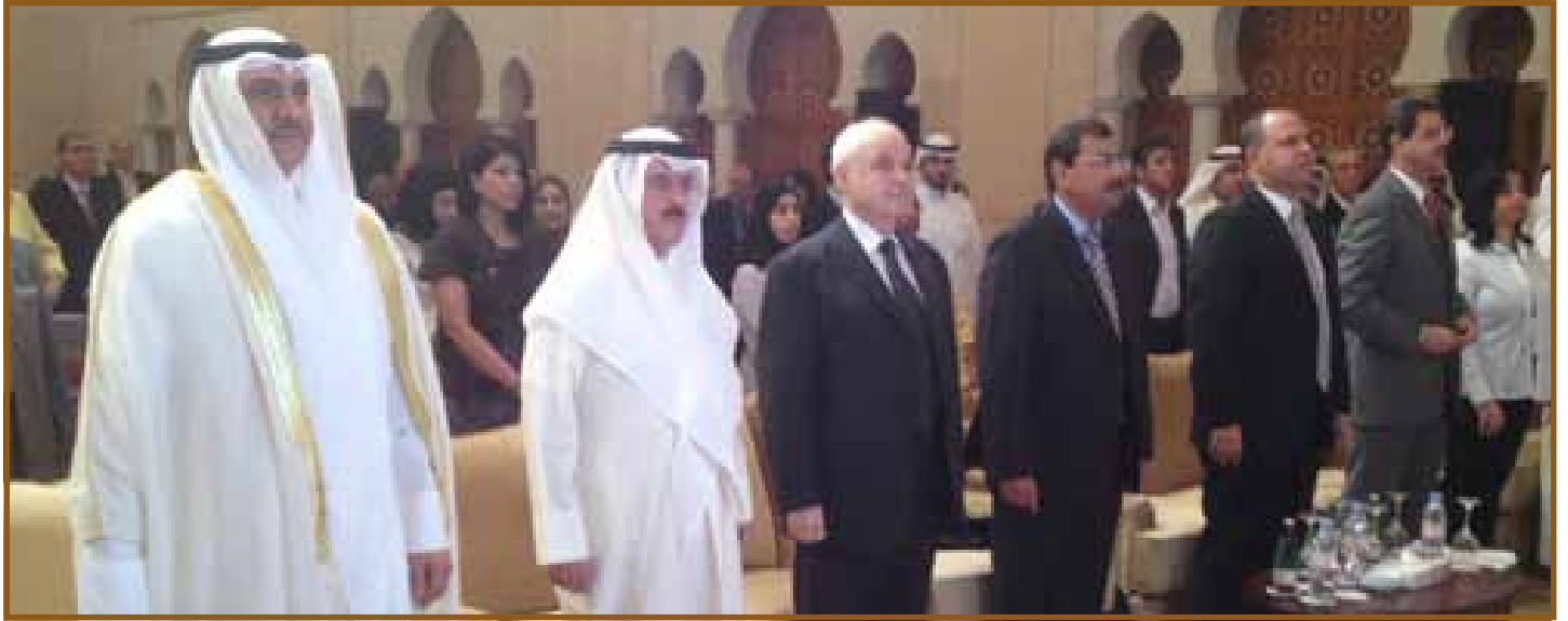
كبار الشخصيات المشاركون في المنتدى

يمكن أن تسهل الوصول إلى الموارد والمحتوى والأدوات والتي يمكن أن تدفع عجلة الإبداع والابتكار في مجتمعنا ككل.