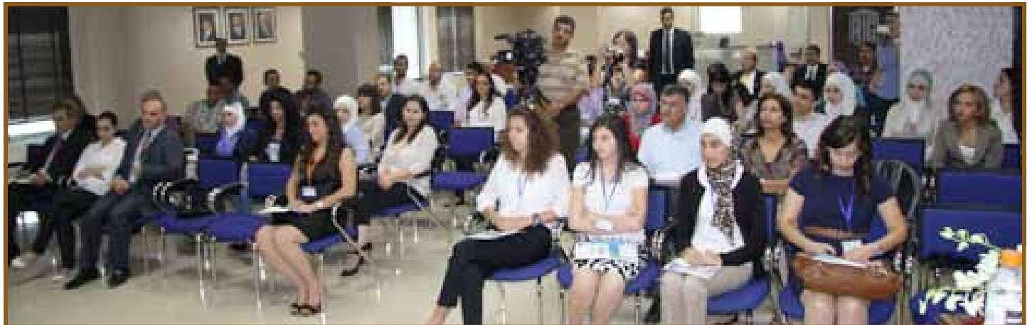
جانب من المشاركين

وطالب الحضور لانتداب مجموعة منهم يمثلونهم في منتدى تطوير السياسات الإقتصادية ويكونوا متحدثين باسم الغرفه في المنتدى الذي يعد المؤسسة الوطنية المخلصه والعامل الايجابي في دراسة اوضاع الإقتصاد للأردن.