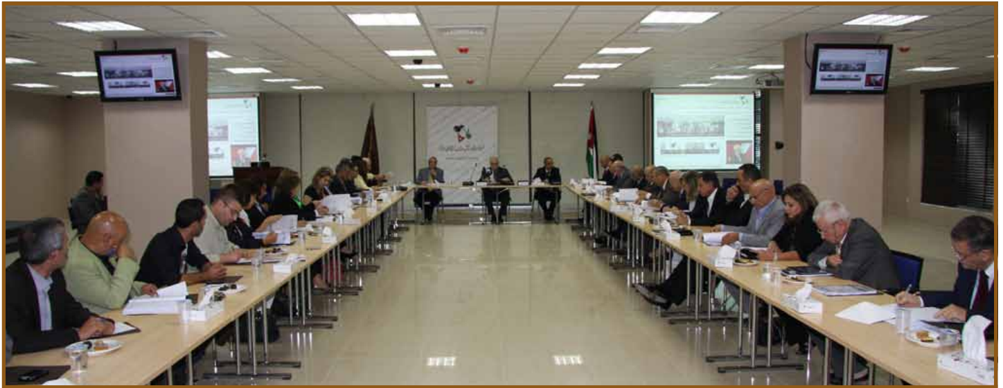
المشاركون في الاجتماع

متابعة ومراقبة الاداء الحكومي. خدمة للحكومة بحيث نطلعها على المعايير والمؤشرات الناجمة عن الاداء. وهذا يتطلب معايير لكافة المواضيع إذ ان «ما لا يمكن قياسه لا يمكن ادارته».