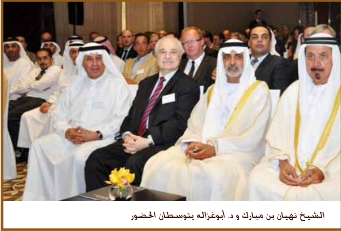
الشيخ نهيان بن مبارك و د. أبوغزاله يتوسطان الحضور

وأشار د. أبوغزاله الى احدى الميزات المثيرة في الاعمال بأننا في المجموعة نعتبر ان اعدادنا يدفعوننا للسعي نحو التميز وبقوننا في حالة الاستعداد الانتاجي. كما اشار الى ميزة اخرى هامة هي انه لم يصدر بحق اي من افرادنا اي اتهام قضائي او مالي أو مهني أو اداري منذ انطلاقتنا عام ١٩٧٢.