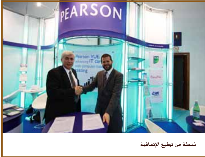
لقطة من توقيع الإتفاقية

تقدم بيرسون «VUE» الملايين من الاختبارات الحاسمة سنوياً في جميع أنحاء العالم لعملائها في مجالات إصدار الرخص والشهادات والقبولات الأكاديمية وأسواق الاختبارات الحكومية والتنظيمية. وهي تفتخر بكونها شبكة مراكز الاختبارات الرائدة في العالم بامتلاكها ما يزيد عن ٥٠٠٠ مركز اختبارات في ١٧٥ دولة. ٢٣٠ منها هي مراكز مهنية تديرها وتملكها شركة بيرسون بالكامل. وتستخدم مراكز بيرسون المهنية تصاميم حائزة على براءة اختراع تم إنشائها خصيصاً للاختبارات المهمة والحاسمة كما توفر بيئة اختبار متنافسة وخاضعة لرقابة دقيقة.