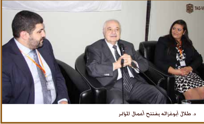
د. طلال أبوغزاله يفتتح أعمال المؤتمر

وتطرق أبوغزاله الى شريط فيديو عرض في بداية الجلسات يتحدث عن الجازات وابداعات شخصيات غير عربيه وقال انا ارى عكس ذلك وفيما رأيناه بعض الظلم، اذ ان كل العلوم وكثير من المهارات التي غيرت العالم بدأت من هذه المنطقه، ومنذ اكثر من خمسمائة سنة كانت المنطقه العربية منطقة الاشعاع والتقدم . ونحن العرب لنا الفضل على العالم بالتقدم، حيث ان أسس كل العلوم البشرية من طب وفيزياء وفلك وغيرها كلها انطلقت من المنطقه العربية.