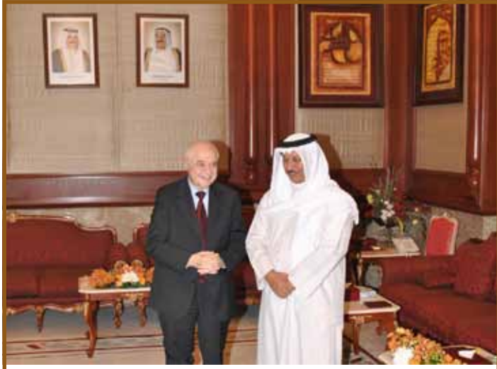
سمو الشيخ جابر المبارك الصباح يستقبل د. أبوغزاله

استقبل سمو الشيخ جابر المبارك الصباح رئيس مجلس وزراء دولة الكويت في قصر بيان العامر سعادة الدكتور طلال أبوغزاله.