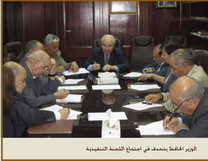
الوزير المحافظ يتحدث في اجتماع اللجنة التنفيذية

عمان - استعرض معالي وزير المالية السيد سليمان الحافظ الوضع الاقتصادي الاردني والإجراءات التصحيحية الحاسمة التي اتخذتها الحكومة مؤخراً. وذلك خلال اجتماع اللجنة التنفيذية لمنتدى تطوير السياسات الاقتصادية الذي عقد برئاسة سعادة الدكتور طلال أبوغزاله رئيس المنتدى وحضور كل من معالي الدكتور جواد العناني رئيس المجلس الاقتصادي والاجتماعي وسعادة النائب ريم بدران نائب رئيس المنتدى. وأعضاء اللجنة التنفيذية عطوفة الدكتور خالد الوزني ومعالي السيد سمير مراد ومعالي الدكتور هاشم غرايبه وعطوفة الدكتور علي مداحه وسعادة السيد نبيل التلهوني وسعادة السيد حسن أبو نعمة.