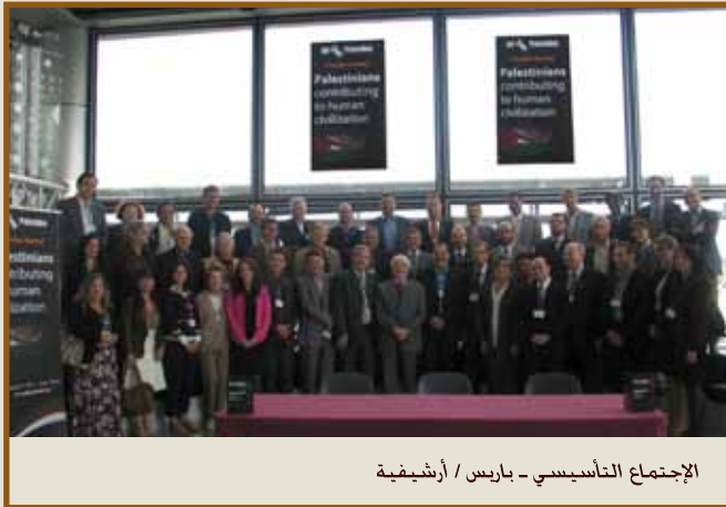
الإجتماع التأسيسي - باريس / أرشيفية

عمان - يعقد مجلس أمناء جمعية كلنا فلسطين اجتماعه يوم ٢٩ أيلول ٢٠١٢ في عمان. وعلى جدول أعماله عدداً من الموضوعات الحيوية، وبحث ما حقق من إنجازات خلال الأشهر الماضية، حيث تعمل إدارة الجمعية على تجميع وحصر المبدعين والفكرين والموهوبين والكفاءات الفلسطينية على مستوى العالم، حيث من المقرر وفقاً للخطة التي وضعتها إدارة الجمعية الوصول إلى عشرة آلاف اسم مع التفاصيل الأخرى المتعلقة بأماكن تواجدهم وأعمالهم ودورهم في المجتمعات التي يقيمون فيها، إذ تم حتى نهاية أيلول حصر نحو خمسة آلاف من هؤلاء المبدعين.