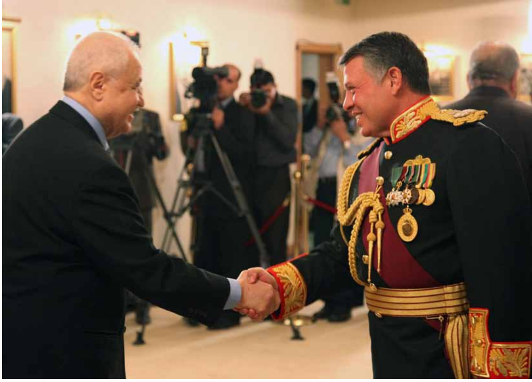
جلالة الملك عبد الله الثاني ابن الحسين يصافح العين الدكتور طلال أبوغزاله

تتسم أعمال وخدمات المجموعة في الأردن كما في سائر البلدان الأخرى بالشمولية وتنوع الخدمات، ويعمل على واجب تقديم الخدمات ٣٥٠ موظفا في مختلف التخصصات وتحت تصرفهم أحدث البنى التحتية في مجال تكنولوجيا المعلومات والاتصالات والحلول الإلكترونية وقواعد للبيانات بموارد نادرة من نوعها أنجزها خبراء المجموعة ونقدم خدمات الإنترنت بأنفسنا إذ تمتلك المجموعة وتسيطر على خطها الخاص المؤمن للإنترنت وذي السرعة العالية، وكونها المركز الرئيسي تقدم مكاتب عمان الدعم المهني واللوجستي لمن يطلبها من المكاتب الأخرى لإنجاز المهام وفق المعايير المطلوبة، ومنها أيضا ممارسة إدارة ضبط ومراقبة الجودة، تقييم الأداء وضبط الجودة ومؤشرات الانتاجية لكل الأعمال وأنشطة المجموعة تأكيدا وتحقيقا للتميز.