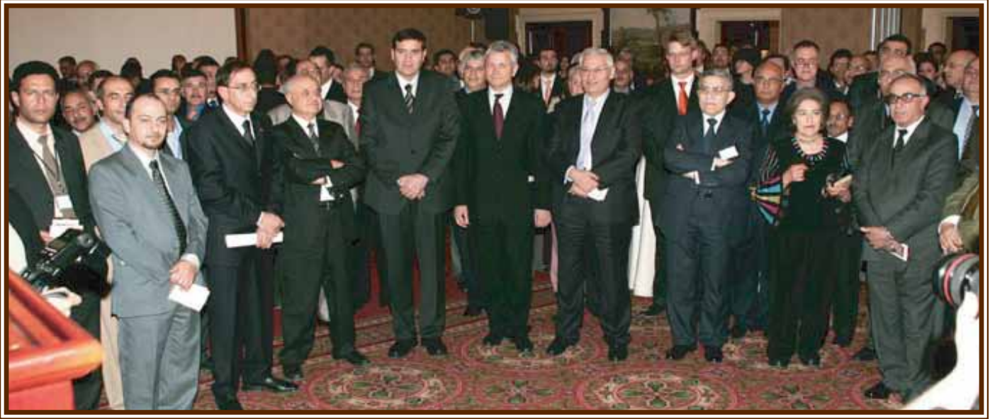
من حفل افتتاح كلية طلال أبوغزاله للدراسات العليا في لإدارة الأعمال