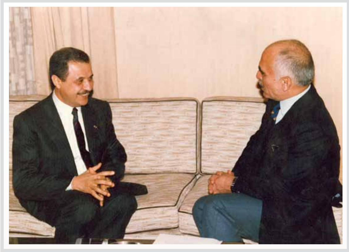
مع صاحب الجلالة المغفور له الملك الحسين بن طلال

مكاتب الأردن تخطت كل الحواجز وتنتقل و باستمرار من إنجاز نوعي إلى آخر، ففيها المكتب الأقليمي لشركة طلال أبوغزاله للملكية الفكرية «أجيب» الشركة الرائدة والأولى في العالم في مجالها ومنها تنطلق المبادرة تلو الأخرى لخدمة المجتمع إنطلاقاً من المسؤولية الاجتماعية والتي تتركز في بناء القدرات البشرية.