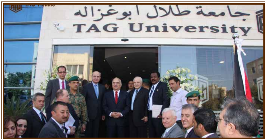
من حفل افتتاح جامعة طلال أبوغزاله - المؤتمر الإقليمي

نحن نؤمن بقدراتنا وواجبنا ومسؤولياتنا على المستويين الإقليمي والدولي، ولهذا أطلقت المجموعة في العقد الأخير جملة من المبادرات النوعية الخلاقة وخاصة في مجال الخدمات المهنية في التعليم وبناء القدرات البشرية تمثلت بتأسيس الجامعات والكليات والأكاديميات، ومنها جامعة طلال أبوغزاله - جامعة العالم - وهي متاحة لكل انسان على وجه الأرض للحصول على تعليم متميز وفق أحدث ما توصل اليه العلم من أجل الدخول إلى عصر المعلومات.