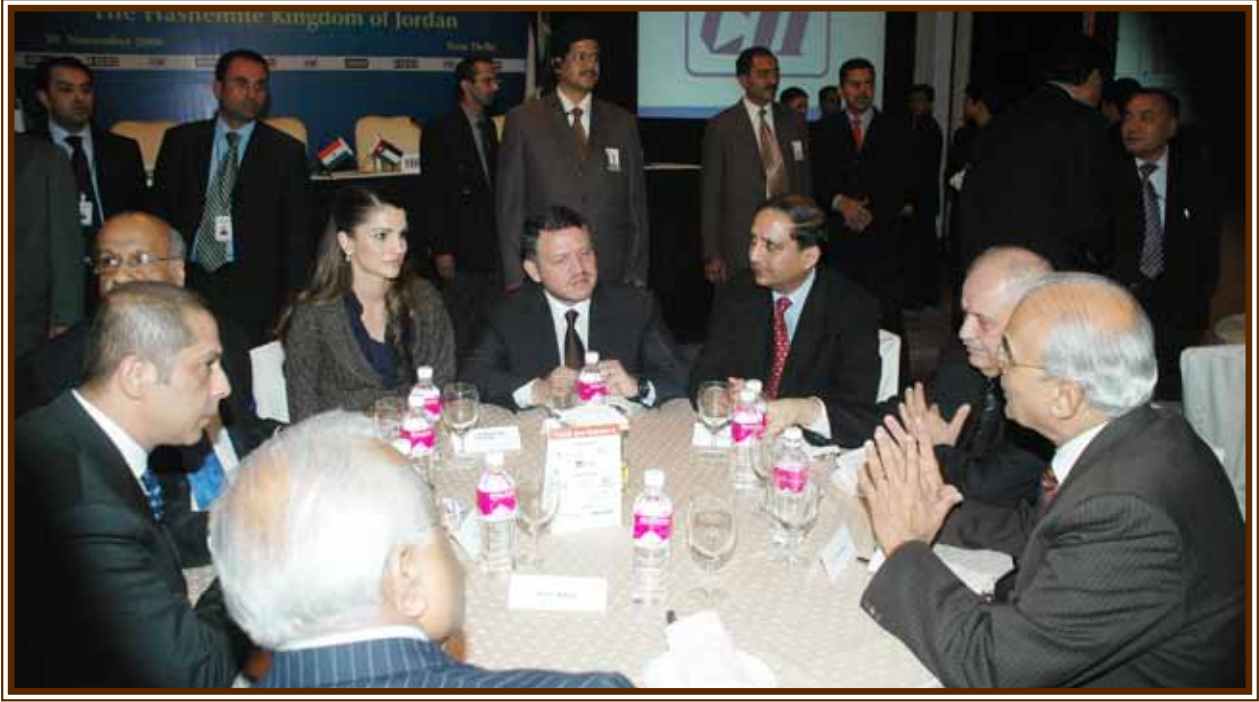
د. طلال أبوغزاله على مائدة جلالة الملك عبدالله الثاني وجمالاته الملكة رانيا العبدالله